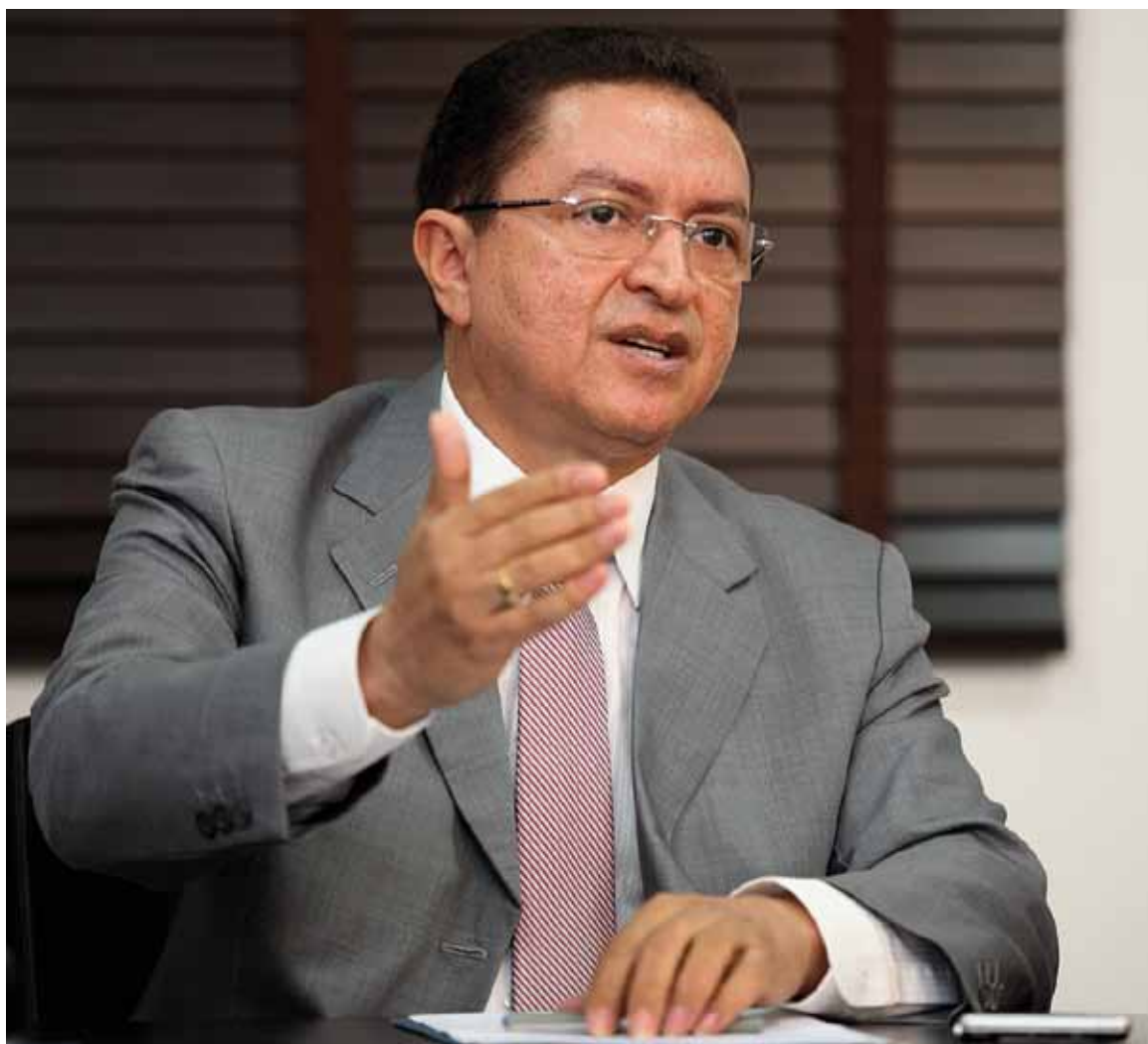
Presidente do TCE de Mato Grosso

Consolidação é a palavra chave para a gestão 2010/2011. Não se trata, porém, de se restringir à conclusão de projetos iniciados nas gestões anteriores ou mesmo de inibir ideias e propostas de inovação. Ao contrário, para consolidar o planejamento de 2005/2011 será intensificado o ritmo das mudanças culturais no Tribunal de Contas de Mato Grosso, disse o conselheiro presidente Valter Albano, ao anunciar os 10 objetivos que integram o plano estratégico para o biênio (veja quadro ao lado).