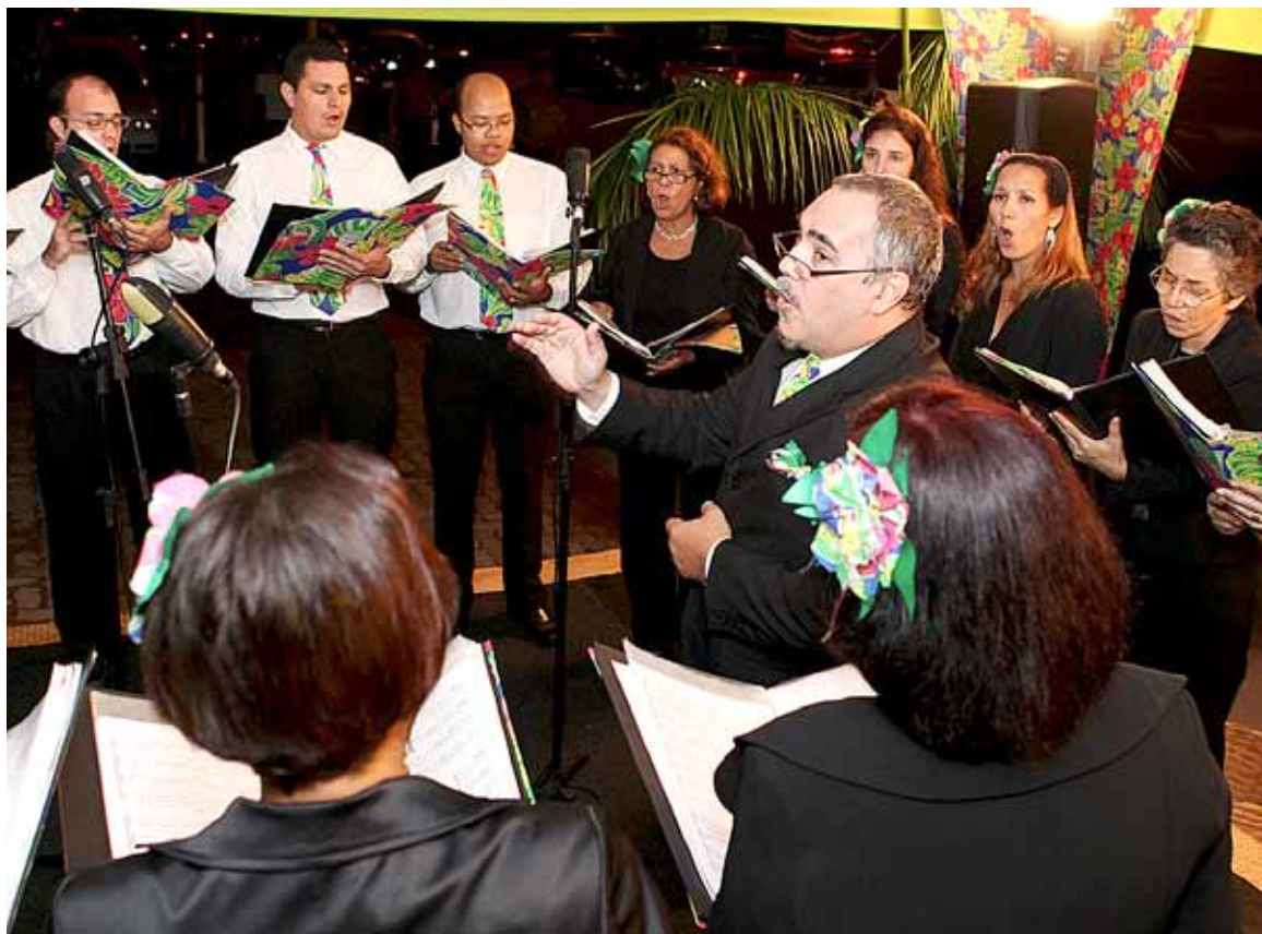
O lançamento do CD está previsto para novembro