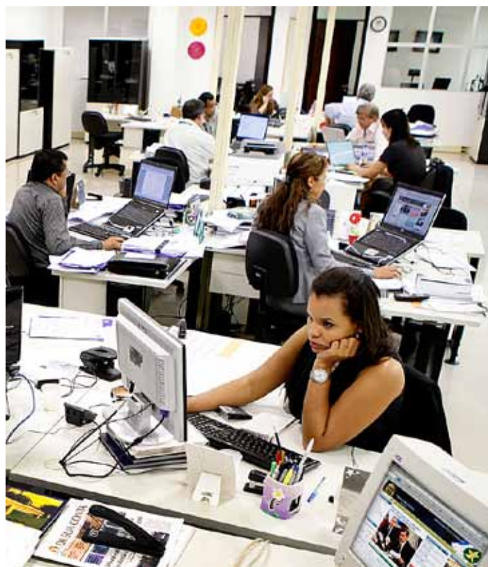
Após ingresso na Ouvidoria, as denúncias são enviadas às Secex para análise

Essa medida foi necessária em razão do grande número de chamados inconsistentes e tratando de assuntos aleatórios. Em alguns casos o processo de denúncia é aberto e, após passar por análise técnica, acaba arquivado justamente por ausência de provas. Essas ocorrências sobrecarregam o trabalho de todas as unidades de controle externo e do próprio plenário.