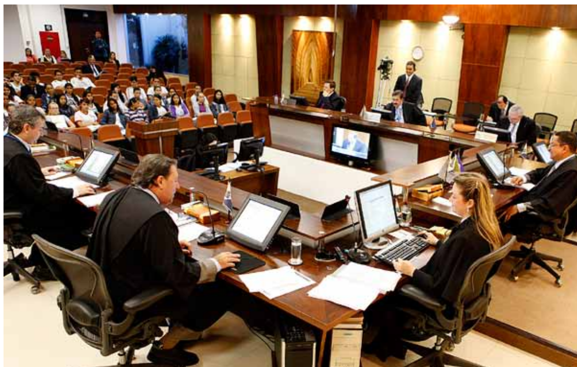
No primeiro semestre o Tribunal Pleno emitiu 2.073 Acórdãos

No total, no primeiro semestre de 2010, o Tribunal Pleno emitiu 2.073 acórdãos, 31 pareceres técnicos, 58 resoluções de consultas, 9 decisões administrativas e 5 resoluções normativas.