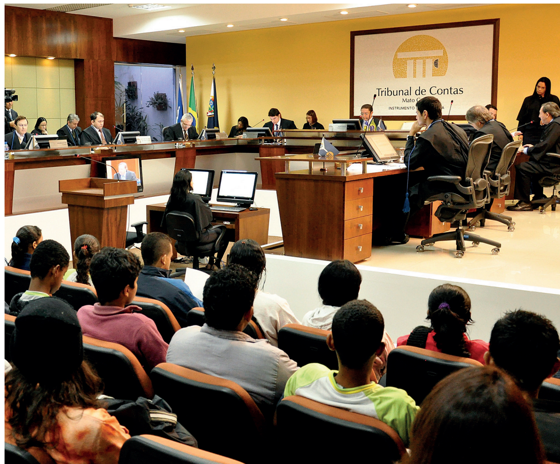
Pleno conclui em novembro a meta de julgamentos