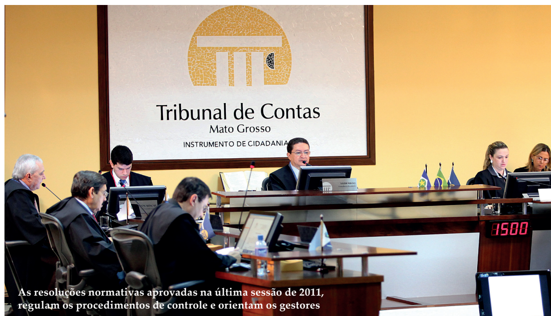
As resoluções normativas aprovadas na última sessão de 2011, regulam os procedimentos de controle e orientam os gestores

A aprovação ainda neste ano obedece ao princípio da anterioridade, possibilitando que os gestores tomem conhecimento, com a necessária antecedência, das normativas que vão regular os procedimentos de controle. Com essa medida o TCE-MT busca cumprir a sua função institucional de prestar orientação pedagógica, de caráter preventivo, contribuindo para a eficiência na administração pública.