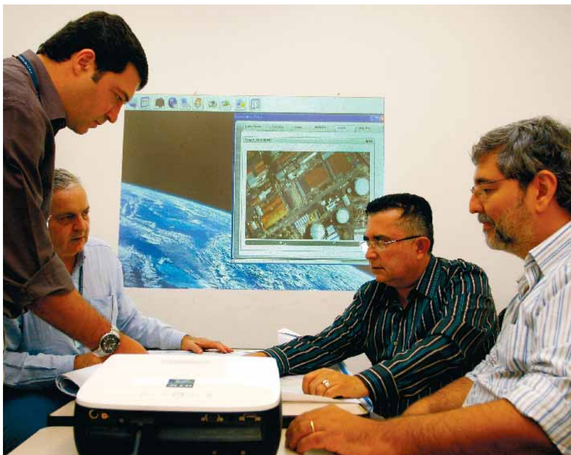
Engenheiros do Tribunal de Contas testam sistema de monitoramento de obras por meio de satélite

Tribunal vai lançar o Sistema Geo-Obras no dia 9 de junho (PAG. 4 E 5)