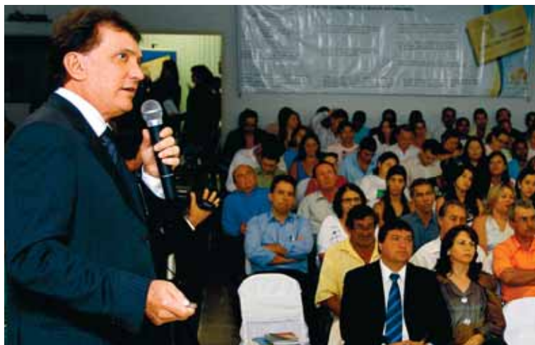
O presidente do TCE-MT, conselheiro Antonio Joaquim, fez a palestra de abertura do evento em Pontes e Lacerda

O Tribunal de Contas de Mato Grosso realizará no dia 25 de junho a terceira edição do 'Programa Consciência Cidadã', desta vez no município de Água Boa. Voltado aos representantes da sociedade civil, gestores públicos, estudantes e cidadãos locais, inclusive dos municípios vizinhos, o programa busca incentivar o acompanhamento da sociedade na aplicação dos recursos públicos – o chamado