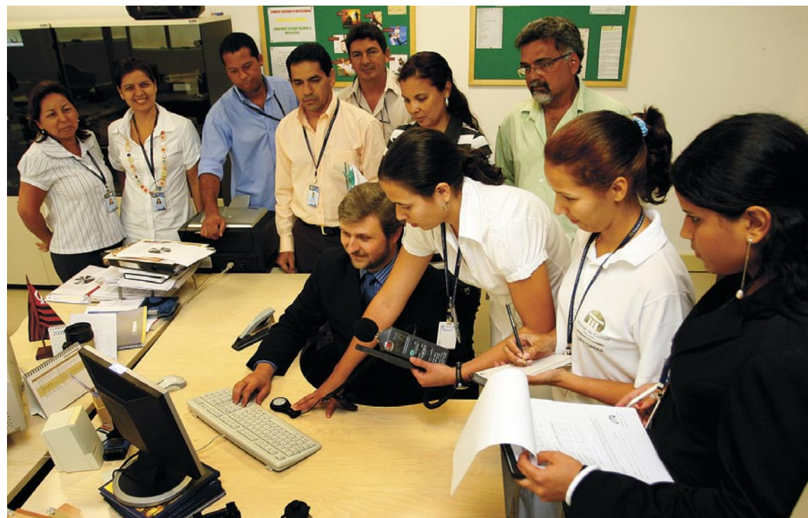
A Comissão de Segurança, Saúde e Meio Ambiente no Trabalho já fez o mapeamento do antigo prédio em 2007

Os membros da Comissão de Segurança, Saúde e Meio Ambiente no Trabalho iniciou, no dia 26 de novembro, o mapeamento das áreas de risco da Escola Superior de Contas e do novo anexo do TCE, Edifício Marechal Rondon. O objetivo é promover a saúde