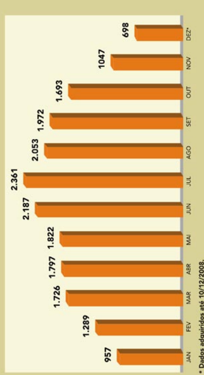
COMPARATIVO MENSAL DO NÚMERO DE CONSULTAS REALIZADAS

Em 2008, foi registrada expressiva procura pelas decisões do Tribunal de Contas de Mato Grosso por meio do link "pesquisa de decisões" do site www.tce.mt.gov.br . Junho (2.187), julho (2.361) e agosto (2.053) foram os meses em que o link foi mais acessado. De janeiro até o dia 10/12, 19.602 buscas foram feitas - uma média de 56,8 pesquisas por dia. O aperfeiçoamento do sistema de ementário contribuiu com esses resultados.