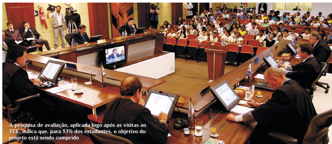
A pesquisa de avaliação, aplicada logo após as visitas ao TCE, indica que, para 53% dos estudantes, o objetivo do projeto está sendo cumprido