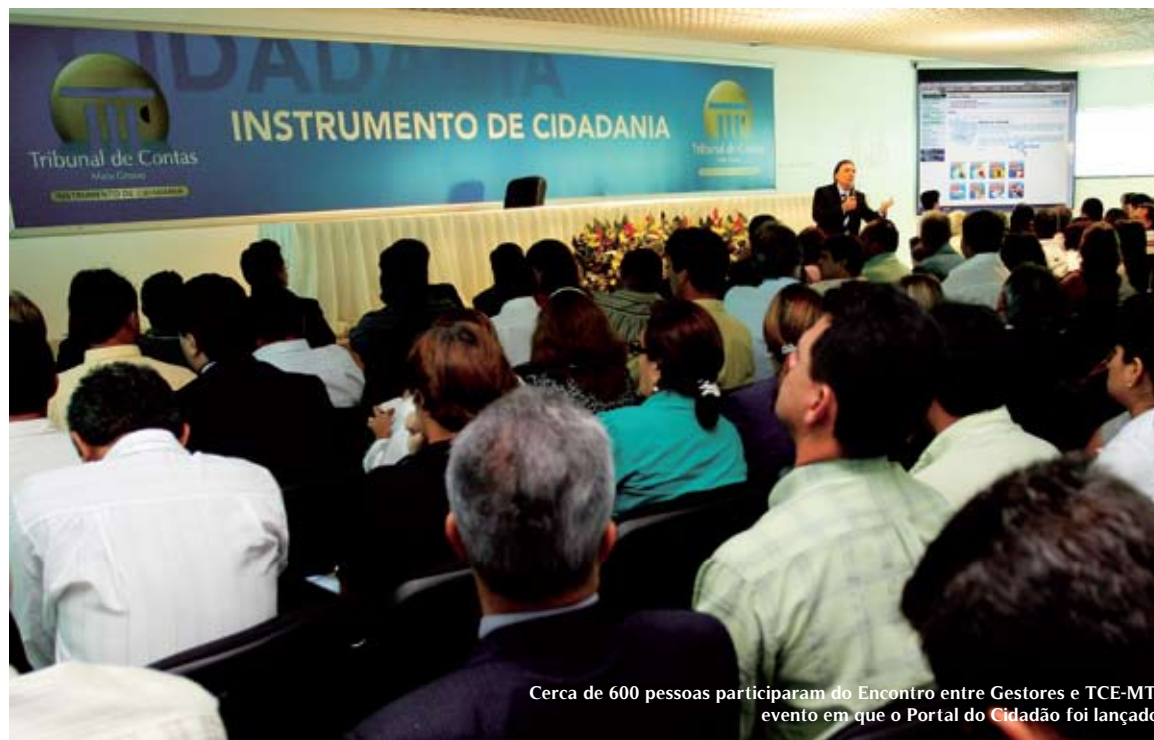
Cerca de 600 pessoas participaram do Encontro entre Gestores e TCE-MT, evento em que o Portal do Cidadão foi lançado

“Ao ampliar o acesso a dados antes restritos ao próprio Tribunal e aos gestores públicos, estamos revolucionando o relacionamento da sociedade com a administração pública”, disse o presidente do TCE-MT, conselheiro Antonio Joaquim. Ainda de acordo com ele, a ferramenta possibilita ao cidadão a