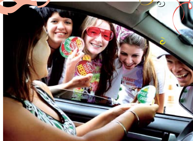
Durante a Campanha Educativa de Carnaval do TCE foram distribuídos preservativos, panfletos e adesivos com orientações aos foliões

DOAÇÃO – No dia 10 de fevereiro, o TCE também realizou sua primeira Campanha de Doação de Sangue e de Medula Óssea de 2009. O evento contou com a participação de 36 servidores, computando ao fim 15 doações de sangue e 34 novas inscrições no cadastro de doadores de medula óssea do Hemocentro do Estado – entidade responsável pelo controle e reposição dos estoques do Hospital da Polícia Militar, do Hospital Universitário Júlio Müller e dos Pronto Socorros de Cuiabá e Várzea Grande.