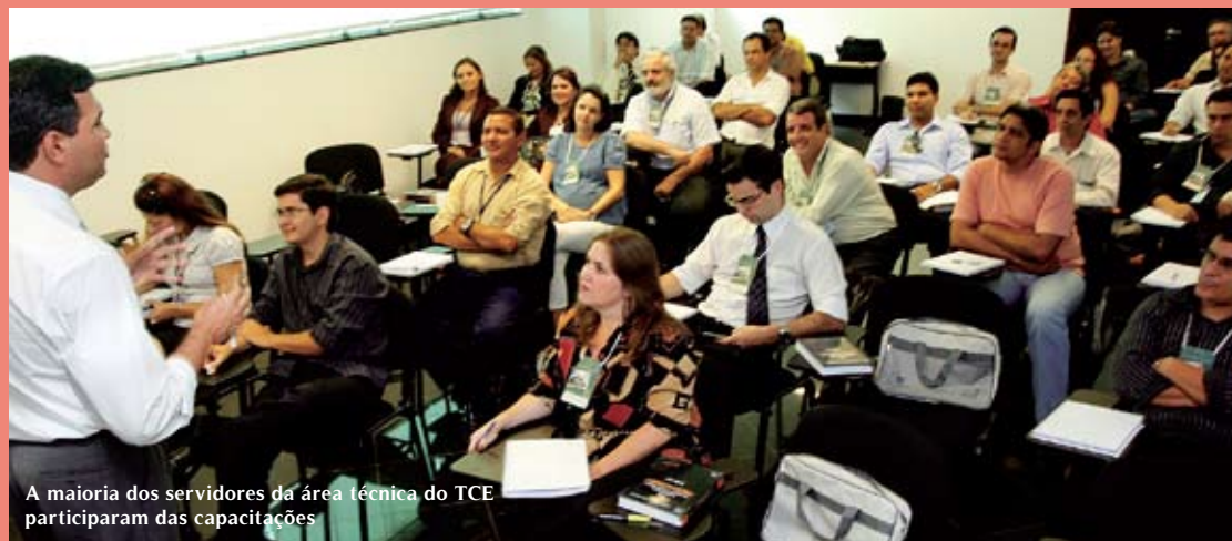
A maioria dos servidores da área técnica do TCE participaram das capacitações

Voltado aos servidores da área técnica do TCE de Mato Grosso, a Escola Superior de Contas já iniciou dois cursos este ano: o primeiro, em Planejamento, Gestão Financeira e Contabilidade Pública e, o segundo, sobre Licitações e Contratos.