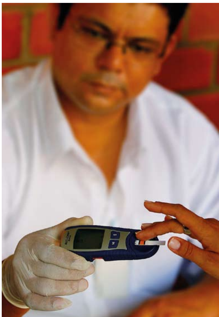
Durante a Campanha Nacional de Diabetes no TCE, 137 servidores foram atendidos

Vinte e sete de abril será dia de receber orientações sobre as causas, formas de prevenção e tratamento da hipertensão arterial no Tribunal de Contas de Mato Grosso. A campanha, organizada pela Coordenadoria Geral de Apoio Humano do órgão, vai oferecer a aferição gratuita de pressão aos servidores das 8h30 às 17h.