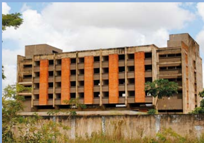
O Hospital Central de Cuiabá é um exemplo de obra paralisada não declarada, mas de conhecimento do Controle Externo

O Tribunal de Contas de Mato Grosso deve elaborar, até final de junho, um novo relatório das obras paralisadas no Estado. O objetivo é comparar esses dados com as informações encaminhadas no ano passado pelo Governo do Estado e Prefeituras.