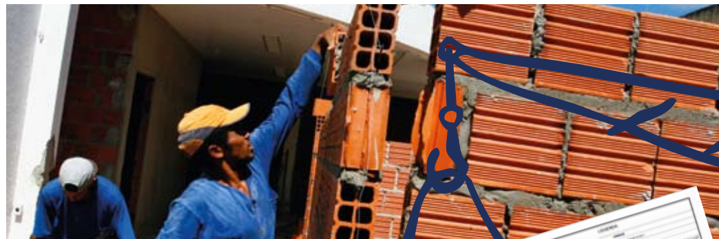
Homens trabalhando na fachada do Centro Cultural