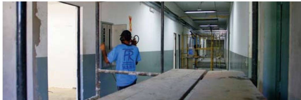
Corredor onde será instalada a Coordenadoria Geral de Apoio Humano