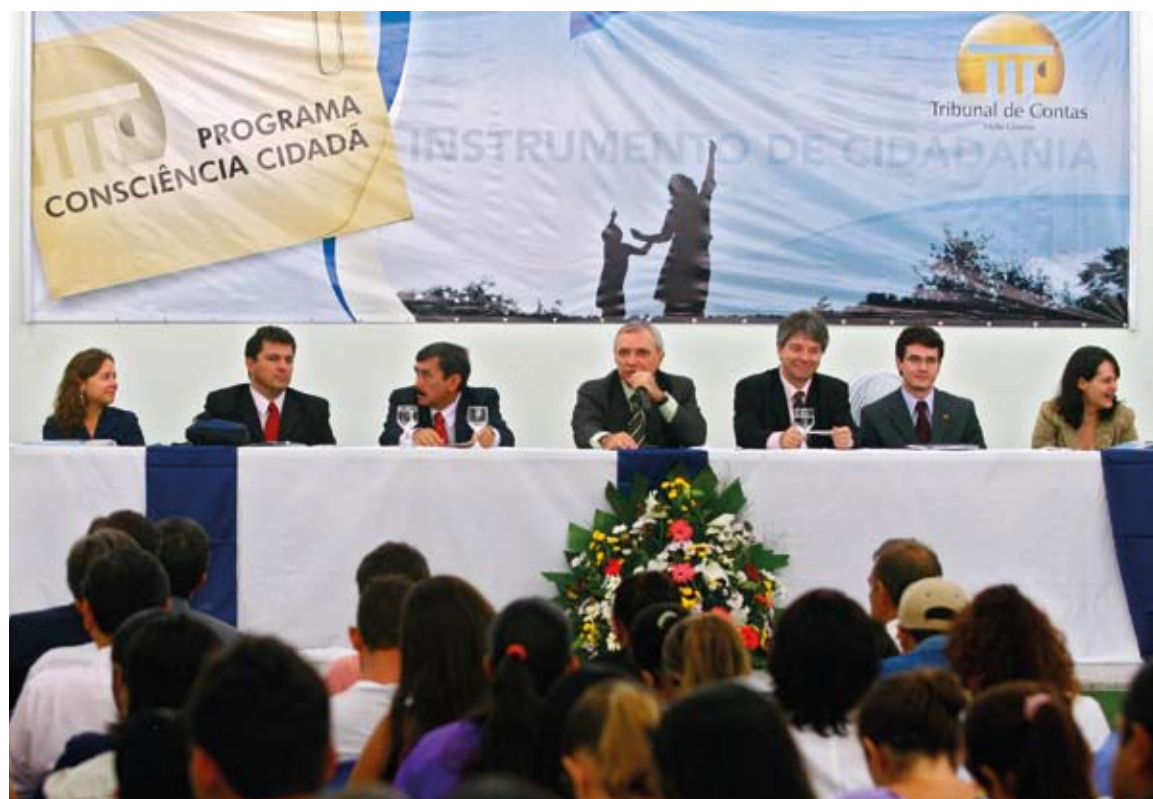
Mais de 300 pessoas lotaram o Centro de Eventos de Diamantino no primeiro evento do Consciência Cidadã no município