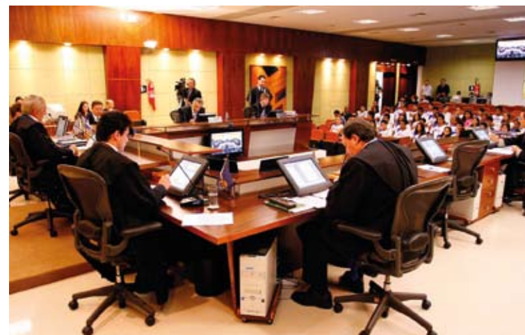
A Medida Cautelar foi votada pelos conselheiros na sessão plenária do dia 14 de abril

A obra está paralisada há 18 anos e vem sendo sub-rogada pela construtora desde 1997, ou seja, as obrigações e direitos contratuais vêm sendo transferidos da Enco para outras construtoras.