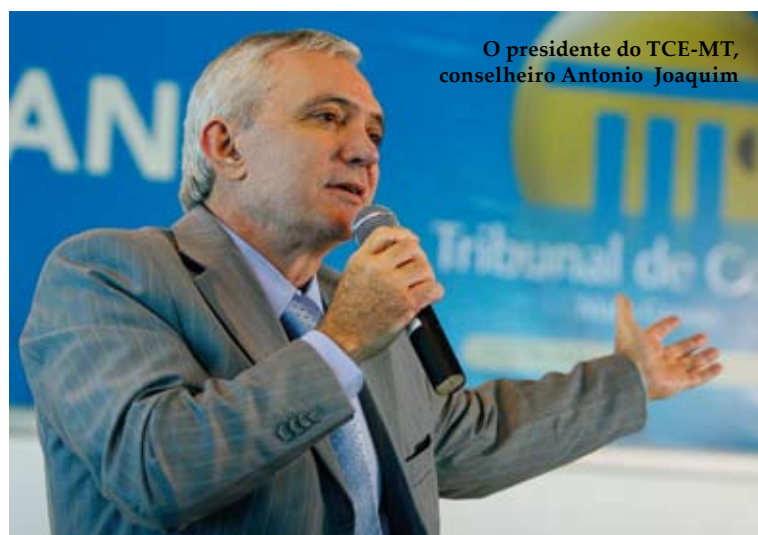
O presidente do TCE-MT, conselheiro Antonio Joaquim

A Lei Federal 131/09, que acrescenta dispositivos a Lei de Responsabilidade Fiscal (Lei Complementar nº 101/2000, agora exige: todos os órgãos e entidades públicas da União, Estados, Distrito Federal e municípios deverão publicar as receitas e despesas públicas em tempo real na internet . O TCE de Mato Grosso, que já disponibiliza informações completas sobre licitações, pessoal e patrimônio público por meio do Portal do Cidadão desde o início do ano, notificou o Governo do Estado e os as 141 prefeituras mato-