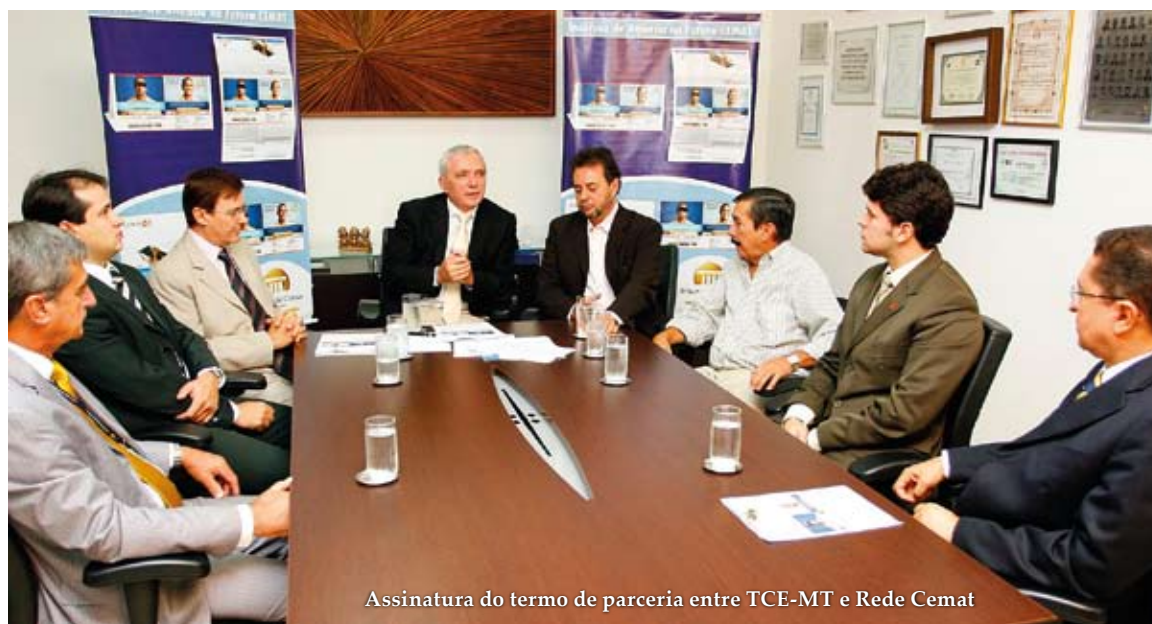
Assinatura do termo de parceria entre TCE-MT e Rede Cemat