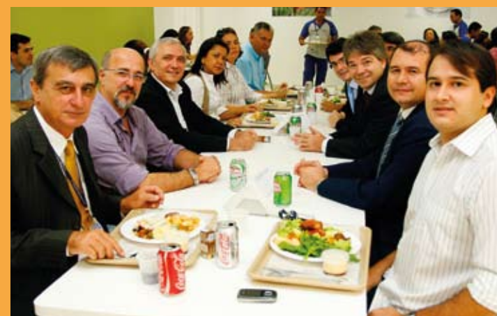
A inauguração foi prestigiada por várias autoridades