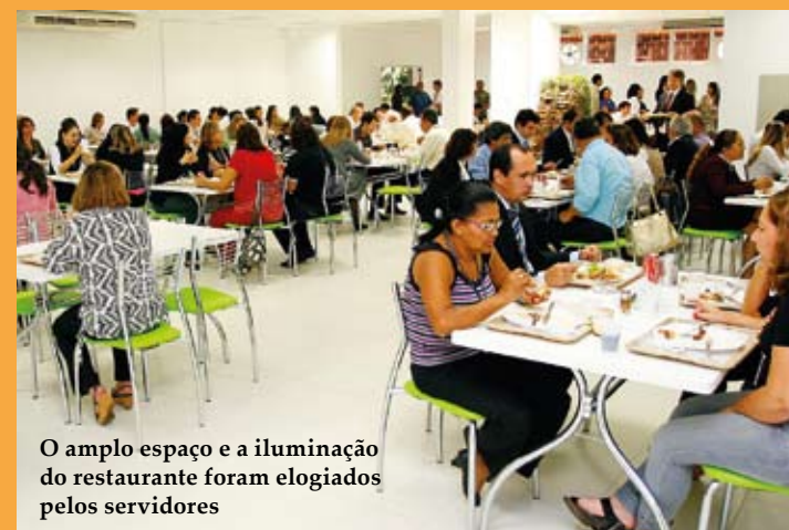
O amplo espaço e a iluminação do restaurante foram elogiados pelos servidores