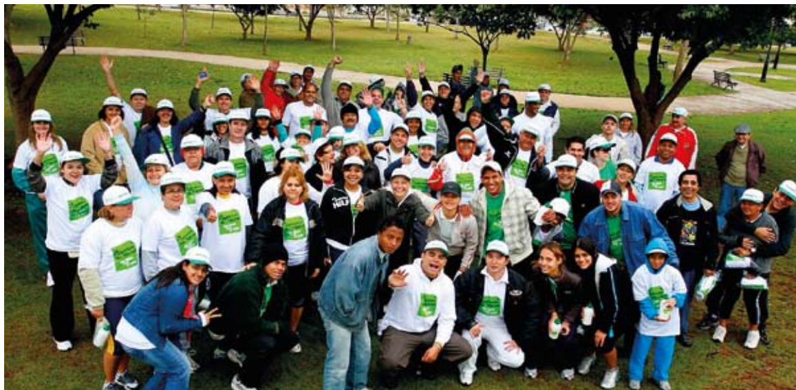
Ao todo, 120 servidores participaram da atividade

Nem o frio de 14º impediu os servidores do Tribunal de Contas de Mato Grosso de participar da 2ª edição da Caminhada do TCE. Entre ativos, inativos e dependentes, 130 pessoas marcaram presença no evento realizado no dia 25 de julho, no Parque Mãe Bonifácia.