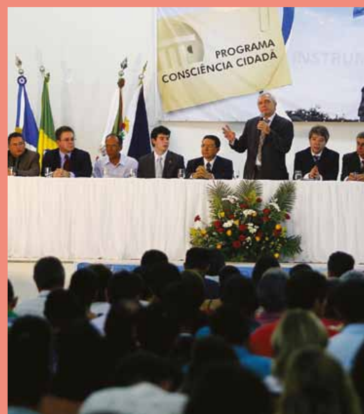
O último evento, realizado no município de Mirassol D'Oeste, reuniu 600 pessoas