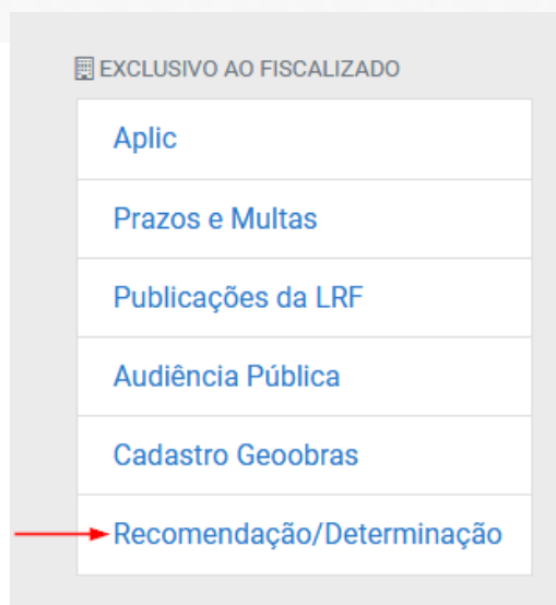
[Figura 8]: Selecionando a consulta “Recomendação/Determinação”.

Localizado o menu, clique na opção “Recomendação/Determinação” e acesse a consulta, conforme a figura abaixo: