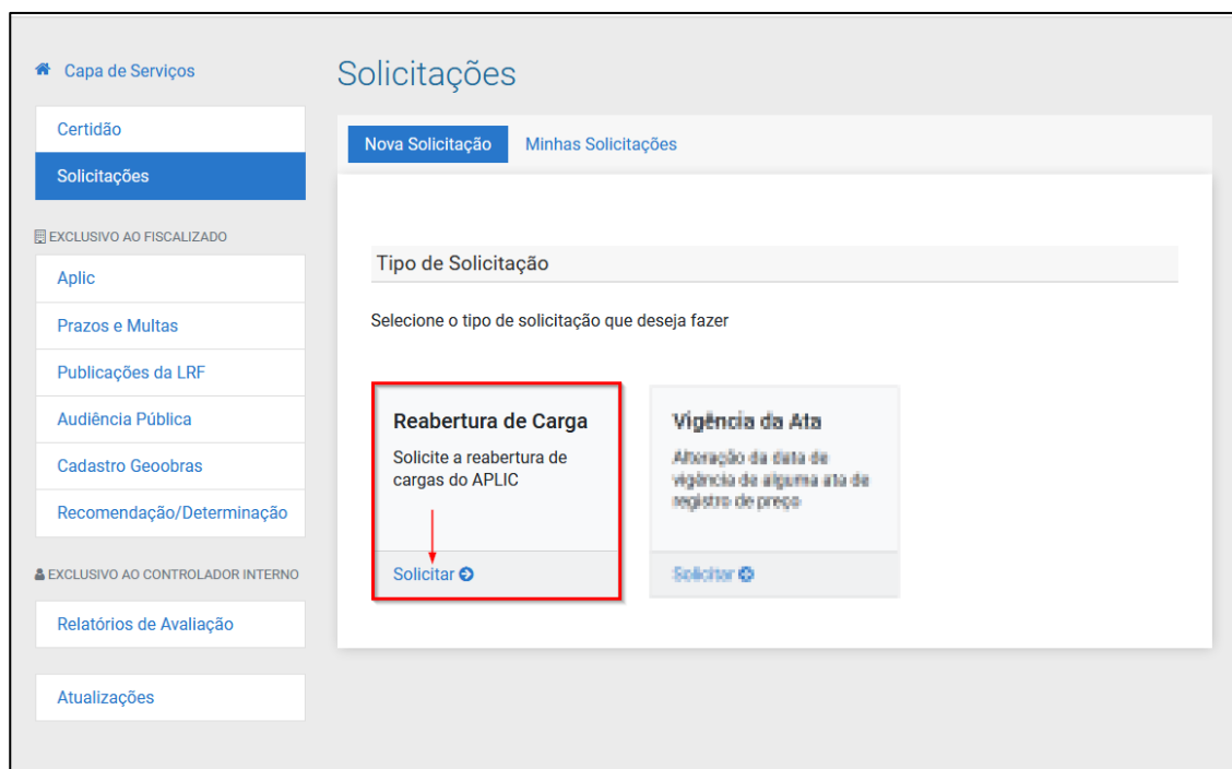
[Figura 3]: Selecionando a caixa de seleção “Reabertura de Carga”.