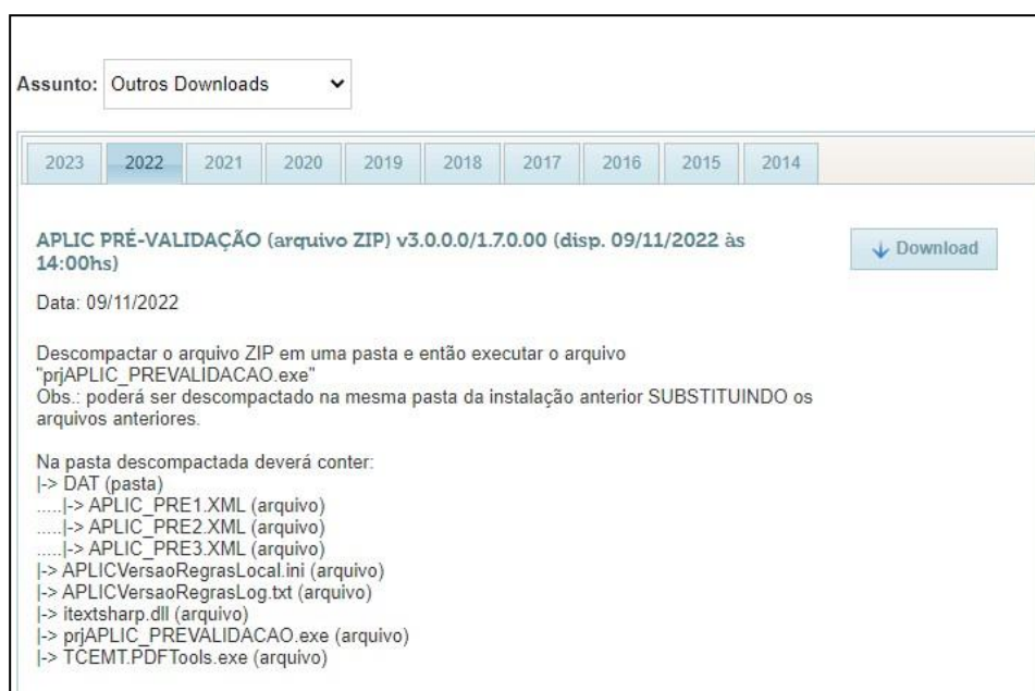
Figura 1: Portal TCE < Página do Aplic < Download da Ferramenta

Informa-se que foi disponibilizado a atualização da ferramenta Aplic Pré-validação, contendo as alterações no Leiaute do Aplic para o exercício de 2023, no portal do TCE-MT ( https://www.tce.mt.gov.br/ < Menu: Portal de Serviços < Aplic < Outros Downloads ).