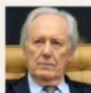
Palestrante: Min. Enrique Ricardo Lewandowski Ministro, aposentado do STF e do TSE; Professor Titular, aposentado da Faculdade de Direito da USP (Largo São Francisco)