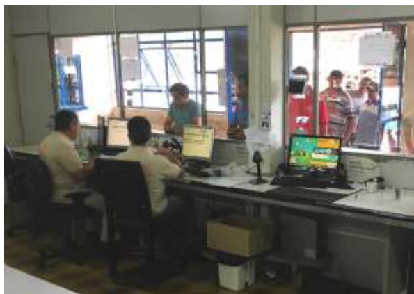
Foto 8 – Posto Fiscal Cachimbo

Situação Encontrada: Servidor teve que adaptar cadeira devido à altura do balcão.