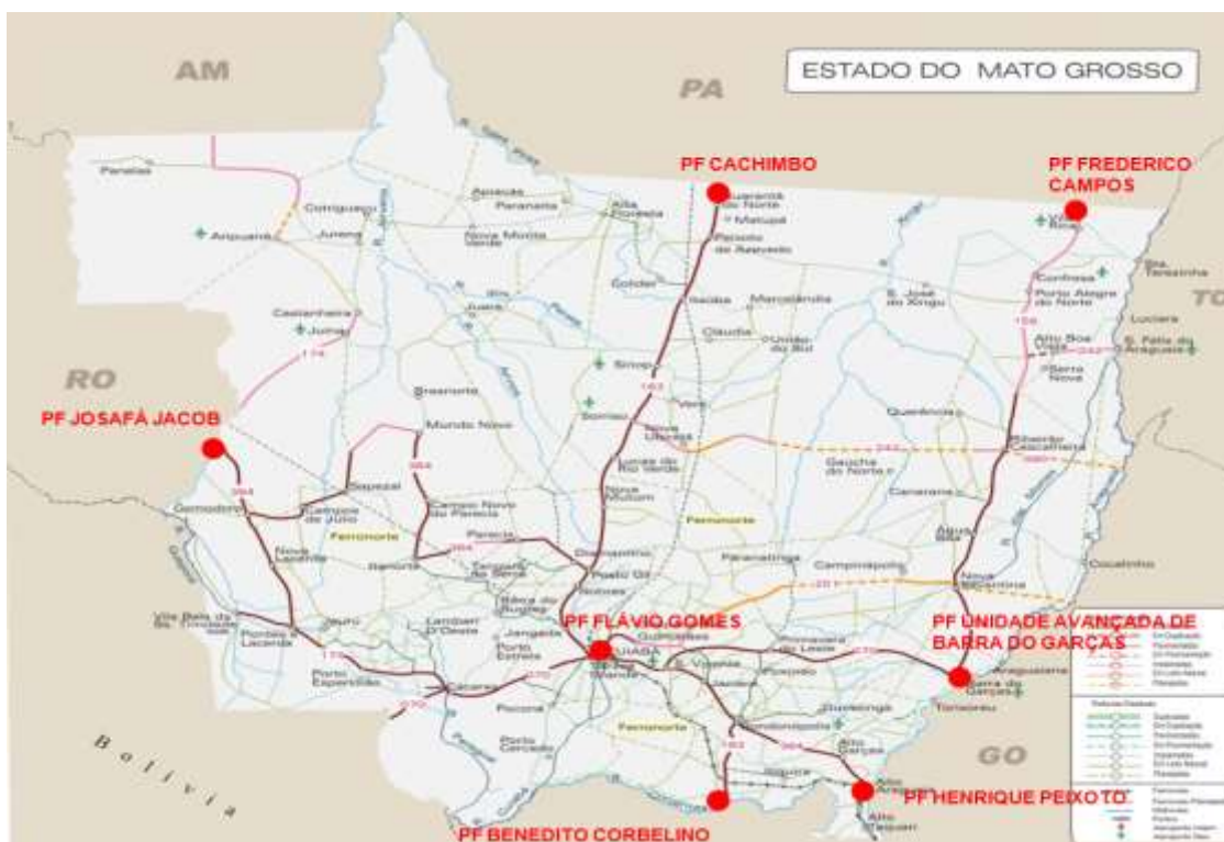
Figura 1 – Localização dos Postos Fiscais

97. A Sefaz/MT conta com seis postos fiscais em atividade: Posto Fiscal Benedito Corbelino (no município de Itiquira); Posto Fiscal Henrique Peixoto (no município de Alto Araguaia); Unidade Avançada de Barra do Garças (no município de Barra do Garças); Posto Fiscal Cachimbo (no município de Guarantã do Norte); Posto Fiscal Josafá Jacob (no município de Comodoro) e Posto Fiscal Flávio Gomes (no município de Cuiabá). Destaca-se que o posto fiscal Frederico Campos (município de Vila Rica) teve suas atividades suspensas em janeiro de 2017.