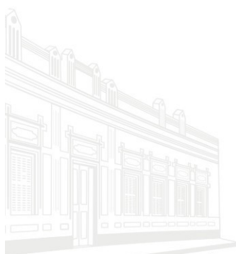
Casa Barão de Melgaço - 1ª Sede 1953

(assinaturas digitais disponíveis no endereço eletrônico: www.tce.mt.gov.br )