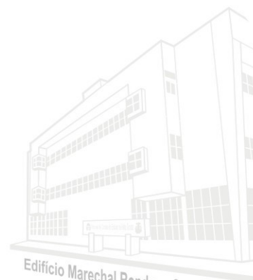
Edifício Marechal Rondon - Sede atual 2013