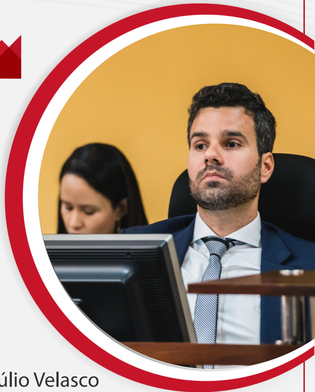
Getúlio Velasco Procurador-geral

Junto com suas assessorias, são responsáveis por fiscalizar todos os recursos e patrimônio públicos do estado e municípios.