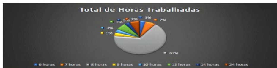
Gráfico 4 - Total de Horas Trabalhadas