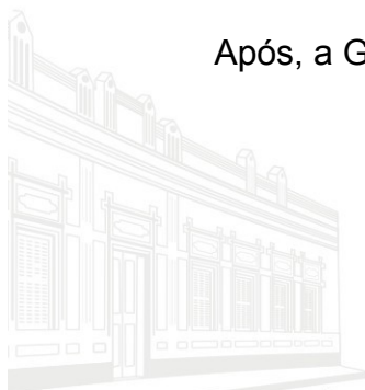
Casa Barão de Melgaço - 1ª Sede 1953

Após, a Gerência de Processos Diligenciados para aguardar o prazo.