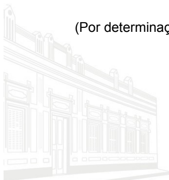
Casa Barão de Melgaço - 1ª Sede 1953

(Por determinação do Excelentíssimo Conselheiro Substituto Luiz Carlos Pereira - Portaria nº 001/2014 - DOE nº 351/03/2014)