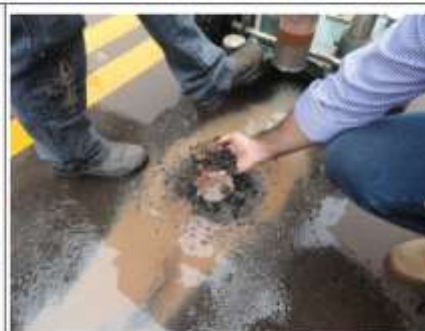
Foto 04 - Amostra de CBUQ (desintegrada) retirada no trecho fissurado