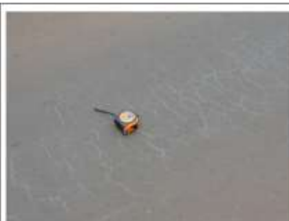
Foto 02 - fissuras a partir da estaca 130.