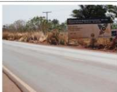
Foto 01 - placa da obra