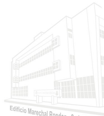
Edifício Marechal Rondon - Sede atual