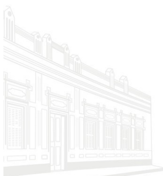
Casa Barão de Melgaço - 1ª Sede