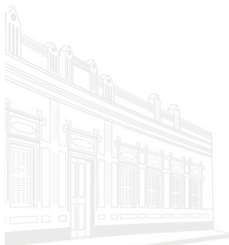
Casa Barão de Melgaço - 1 a Sede 1953