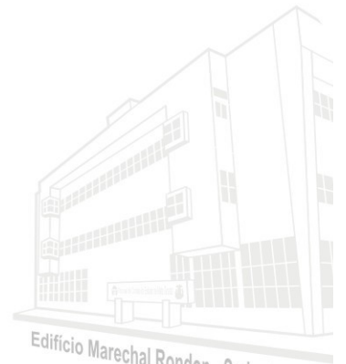
Edifício Marechal Rondon - Sede atual 2013