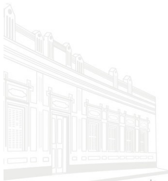
Casa Barão de Melgaço - 1ª Sede 1953