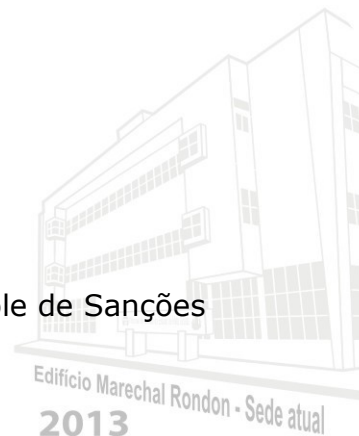
Edifício Marechal Rondon - Sede atual 2013