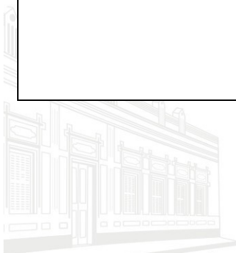
Casa Barão de Melgaço - 1ª Sede 1953