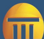
Figura 2 - Apontamentos Relacionados à Manifestante e Não Contraditados