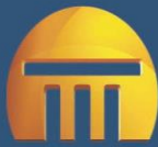
Figura 1 - Grupo Econômico IAD e Empresas com Vínculos Familiares