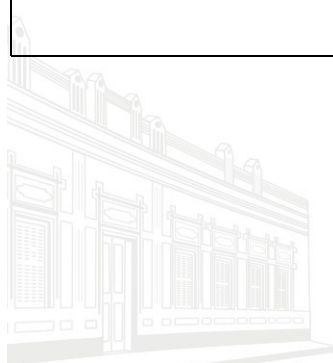
Casa Barão de Melgaço - 1ª Sede 1953

Coordenador do Núcleo de Certificação e Controle de Sanções