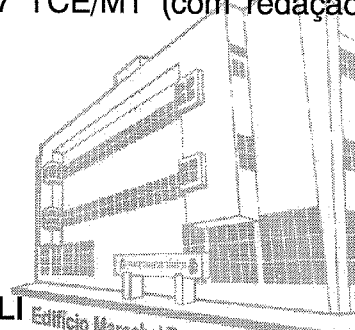
Estifício Marechal Rondon - Sede atual 2013