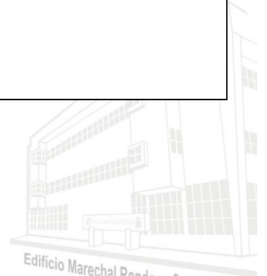
Edifício Marechal Rondon - Sede atual 2013