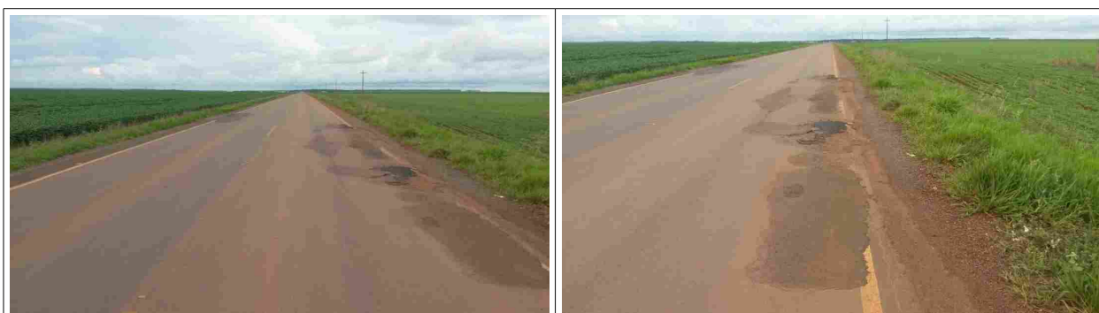
Km 4 – km 4,1

Apresenta-se a seguir registro fotográfico da situação constatada in loco , na data de 20.11.2014, sentido Sapezal – Alto Sapezal, de patologias constantes no termo de inspeção de fls. TC 10/12. Percebe-se que há no trecho, além das intervenções mais antigas (cor mais acinzentada), reparos executados recentemente (cor mais escura).