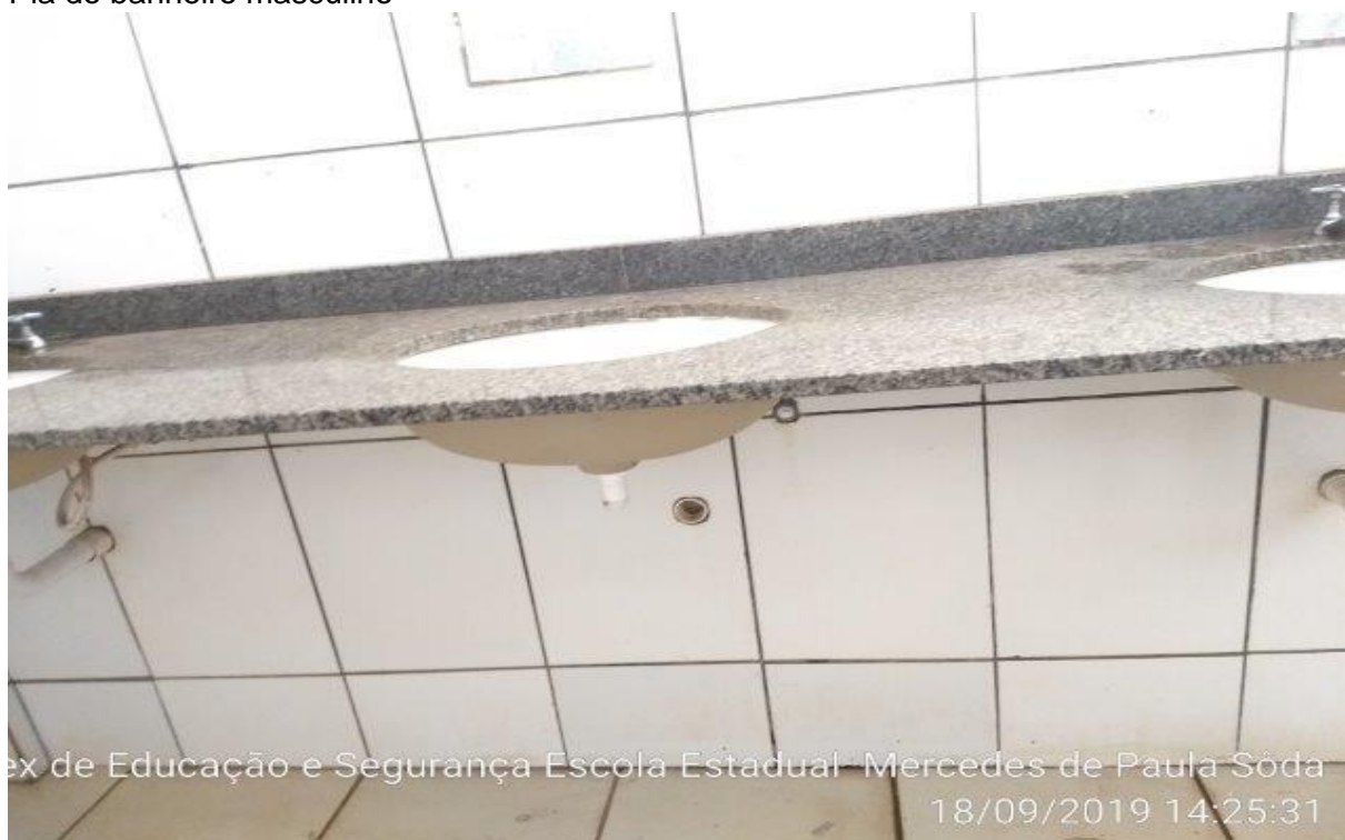
Pia do banheiro masculino

ex de Educação e Segurança Escola Estadual Mercedes de Paula Sôda 18/09/2019 14:25:31