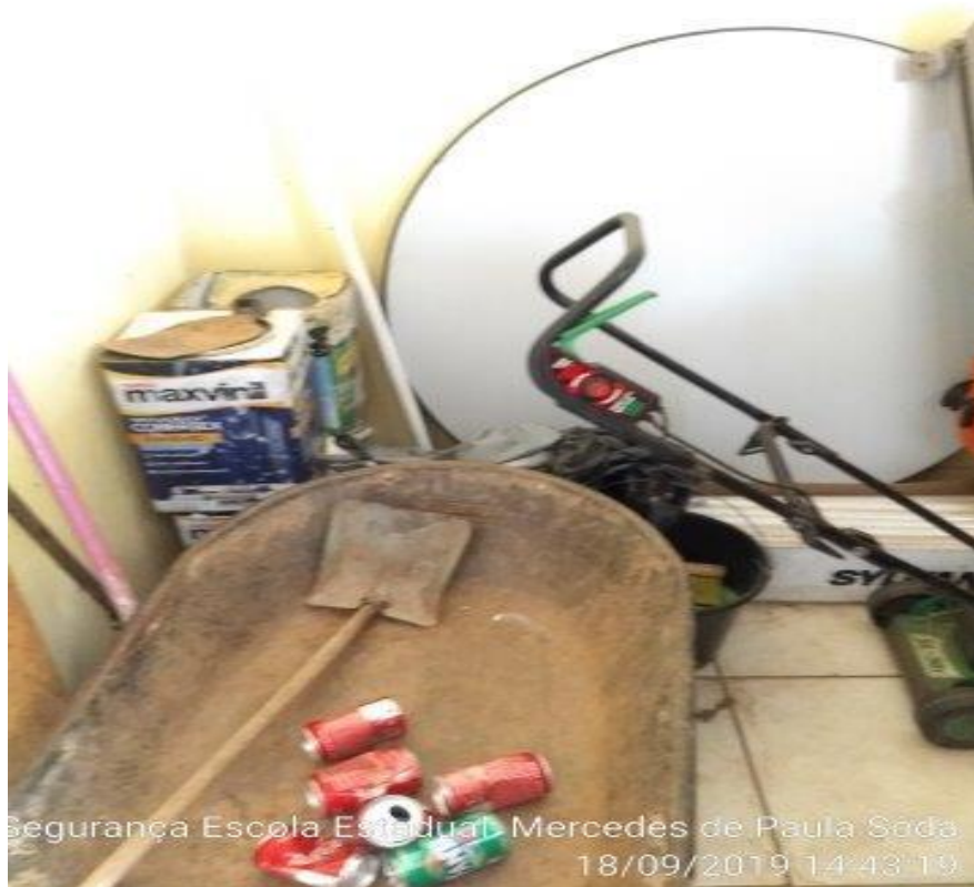
Segurança Escola Estadual Mercedes de Paula Sôda 18/09/2019 14:43:19