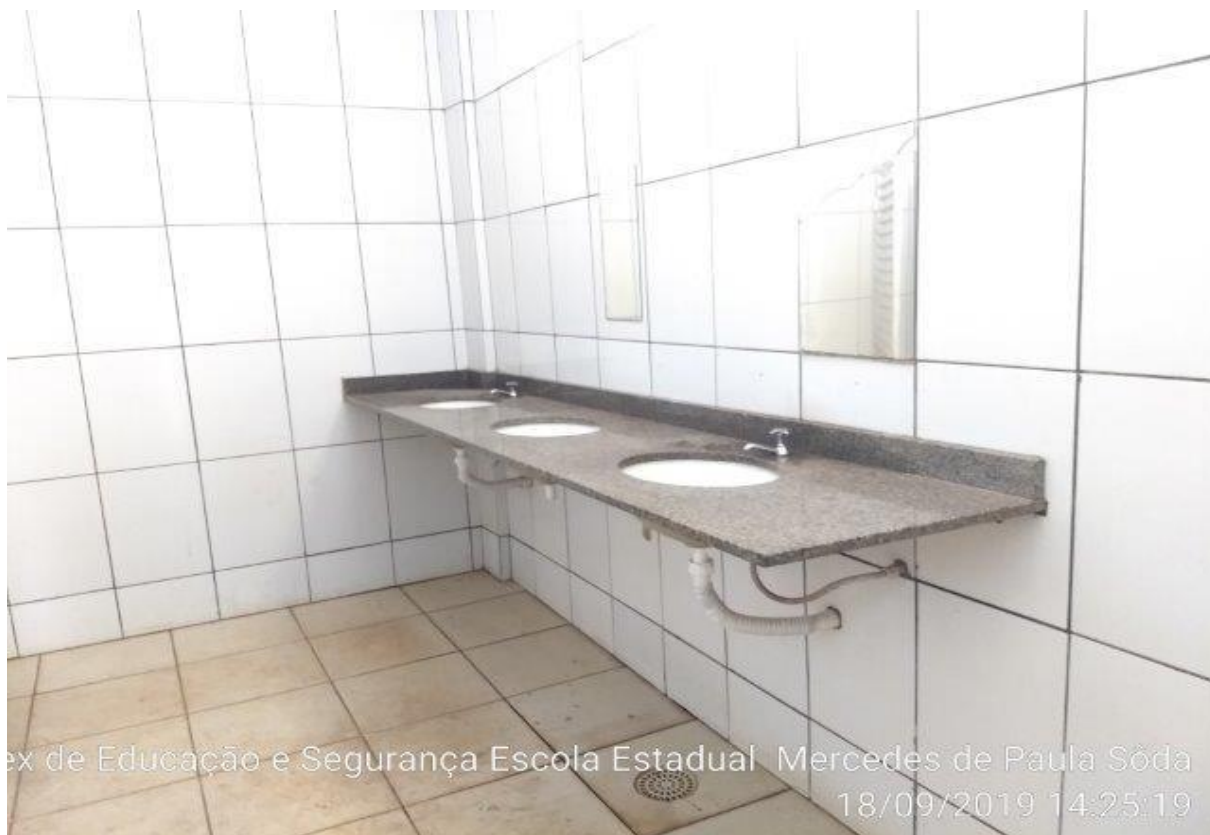
Pia do banheiro masculino

ex de Educação e Segurança Escola Estadual Mercedes de Paula Sôda 18/09/2019 14:25:19