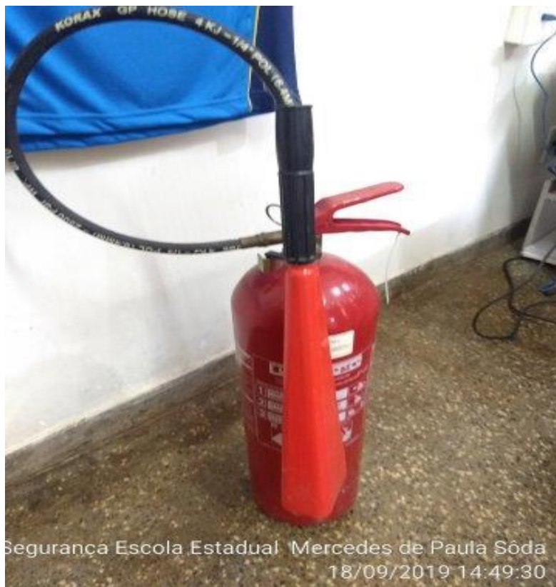
Segurança Escola Estadual Mercedes de Paula Sôda 18/09/2019 14:49:30