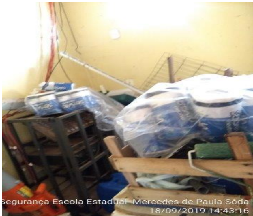
Segurança Escola Estadual Mercedes de Paula Sôda 18/09/2019 14:43:16