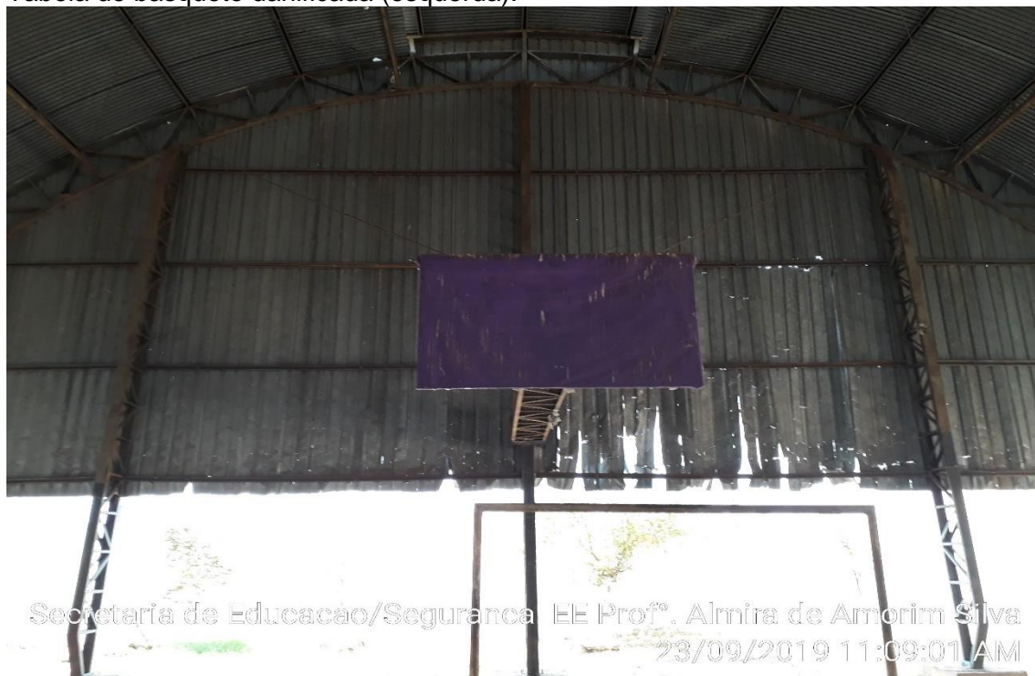
Tabela de basquete danificada (esquerda).

Secretaria de Educação/Segurança EE Profª. Almira de Amorim Silva