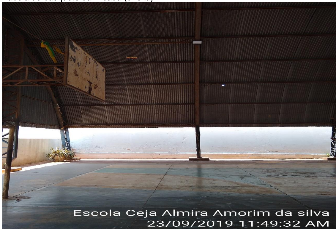
Escola Ceja Almira Amorim da Silva 23/09/2019 11:49:32 AM

Tabela de basquete danificada (direita).