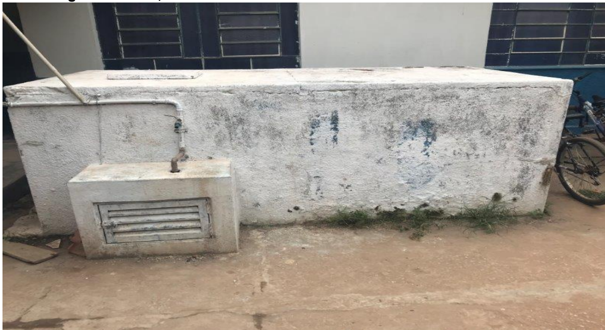
Caixa d'água obsoleta, danificada e mofada