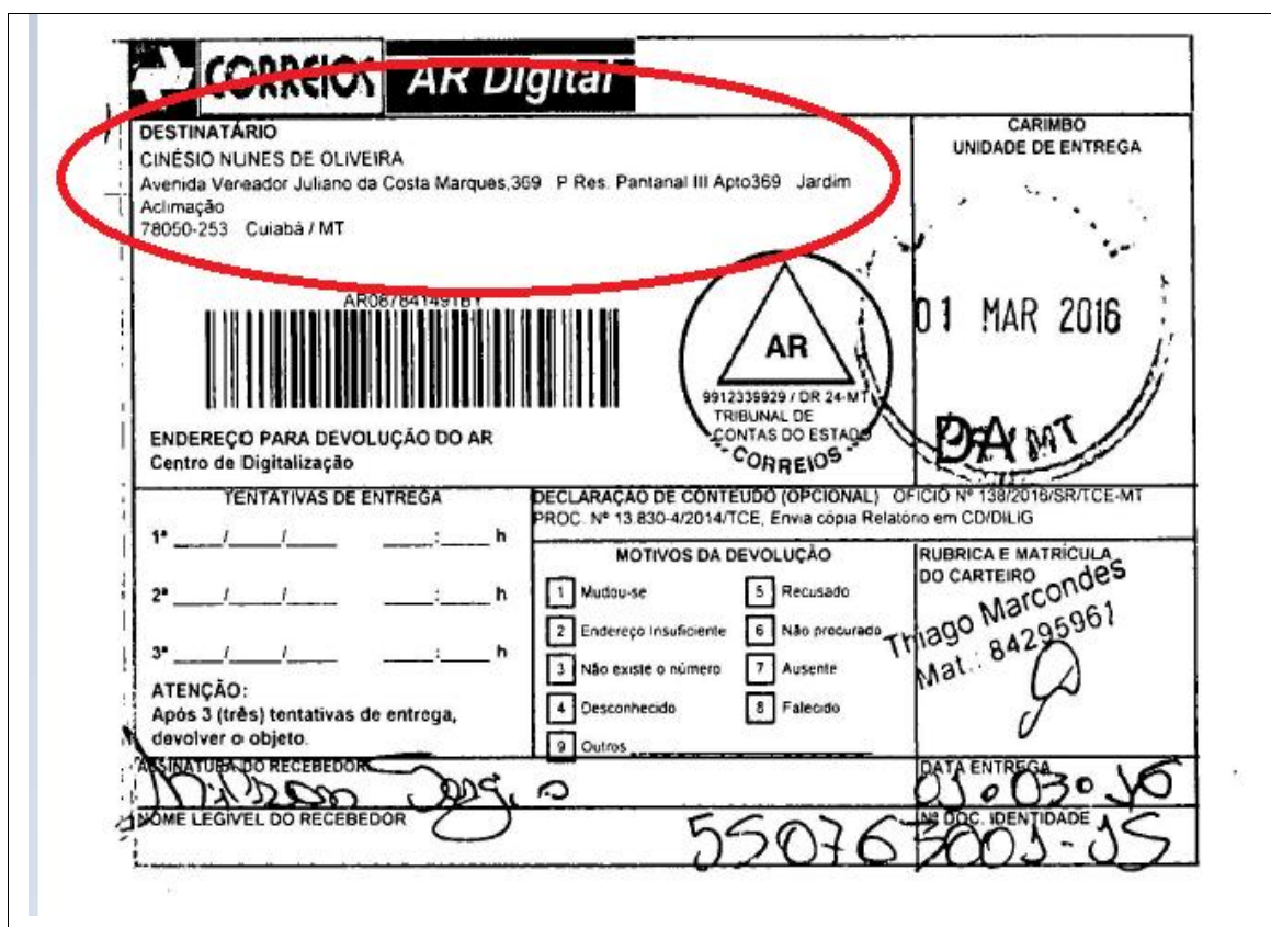
Figura 1: Aviso de Recebimento - Sr. Cinésio Nunes de Oliveira ( endereço residencial ) em 01.03.16: