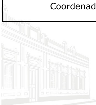
Casa Barão de Melgaço - 1ª Sede 1953

Coordenador do Núcleo de Certificação e Controle de Sanções