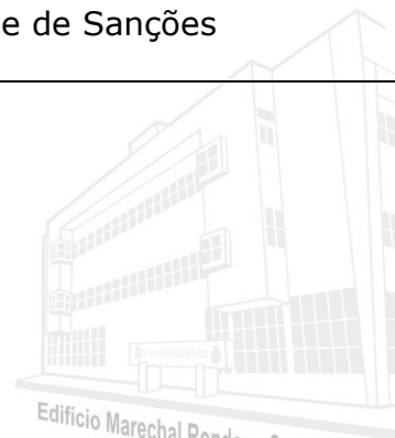
Edifício Marechal Rondon - Sede atual 2013