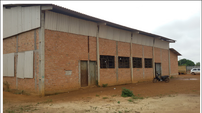
Área externa - 2014