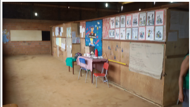
Área interna - 2014