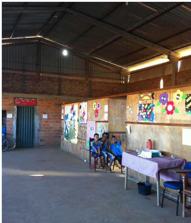
Área interna - 2013

e-mail: secex-conselheirocamposneto@tce.mt.gov.br