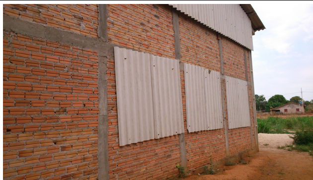
Área externa - 2013