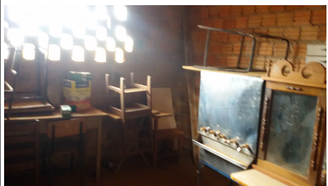
Sala de aula e demais dependências - 2014