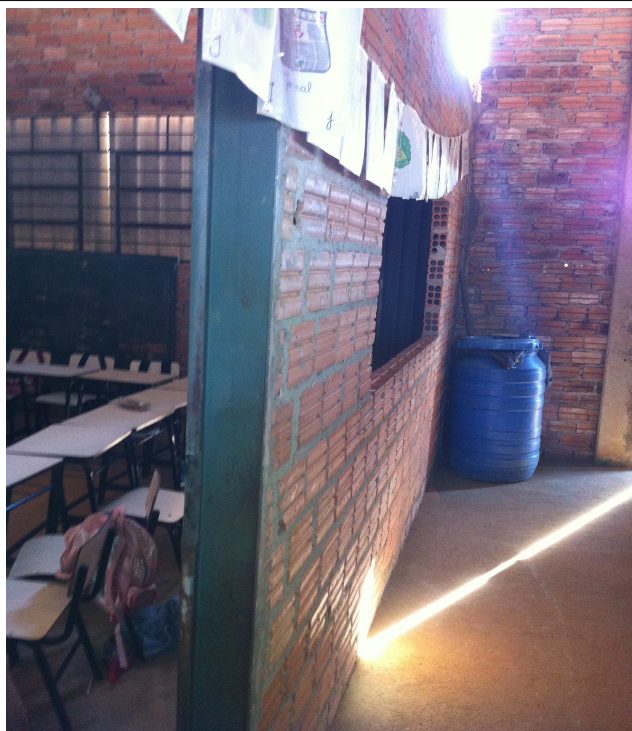
Sala de aula e demais dependências - 2013