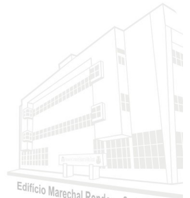
Edifício Marechal Rondon - Sede atual 2013