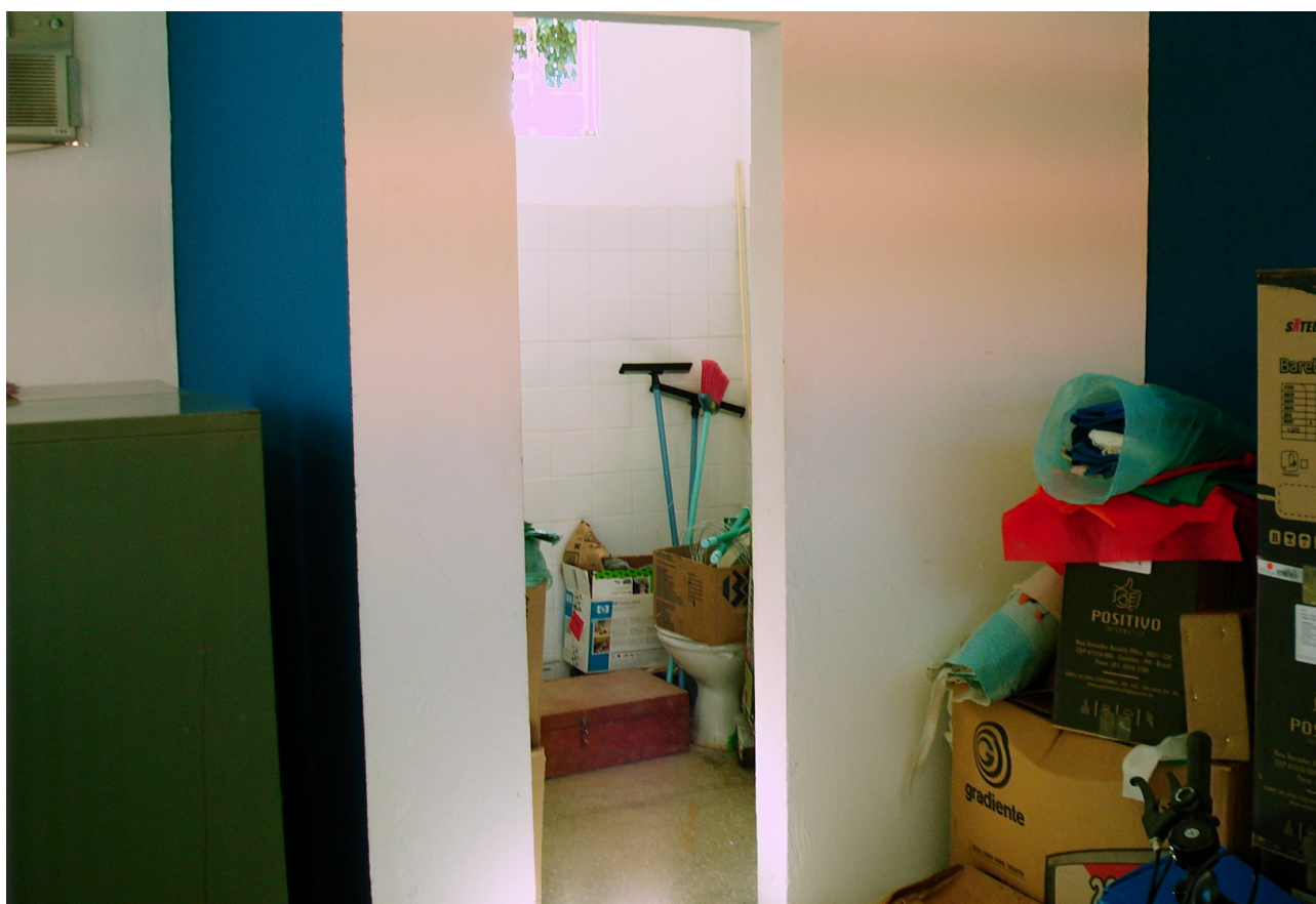
Foto 26: Falta instalação de portas nos banheiros da direção e secretaria.