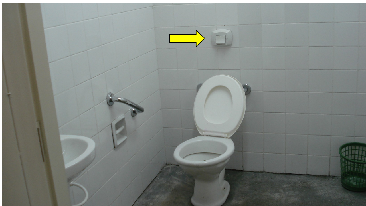
Foto 17; Bacia sanitária PNEE não instalada e válvula de descarga fora de especificação.