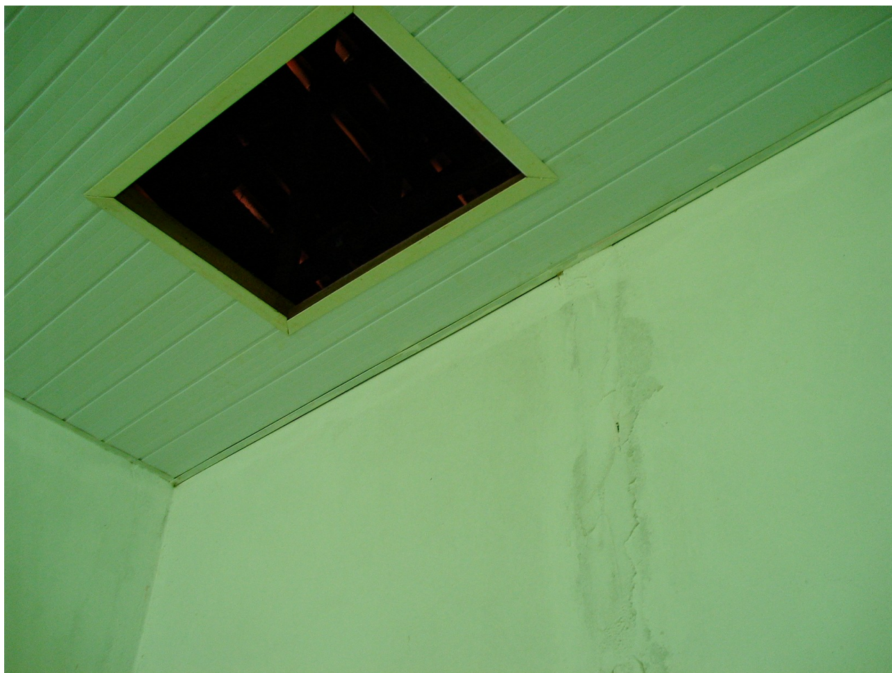
Foto 7: Forros dos banheiros não foram substituídos, revestimento apresenta emendas com acabamento e pintura deficientes.