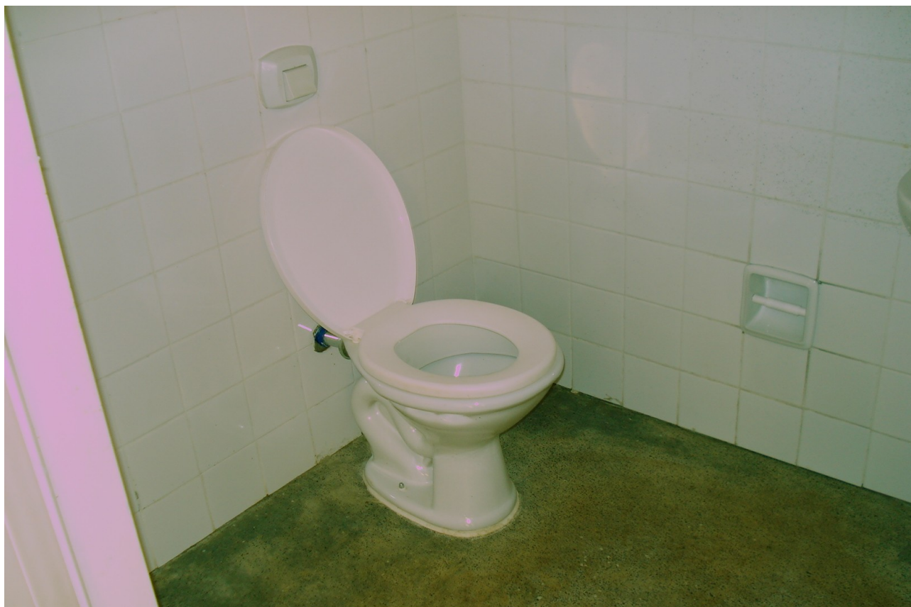
Foto 4: Bacias sanitárias dos banheiros PNEE estão fora de especificação e barras de apoio não foram instaladas.