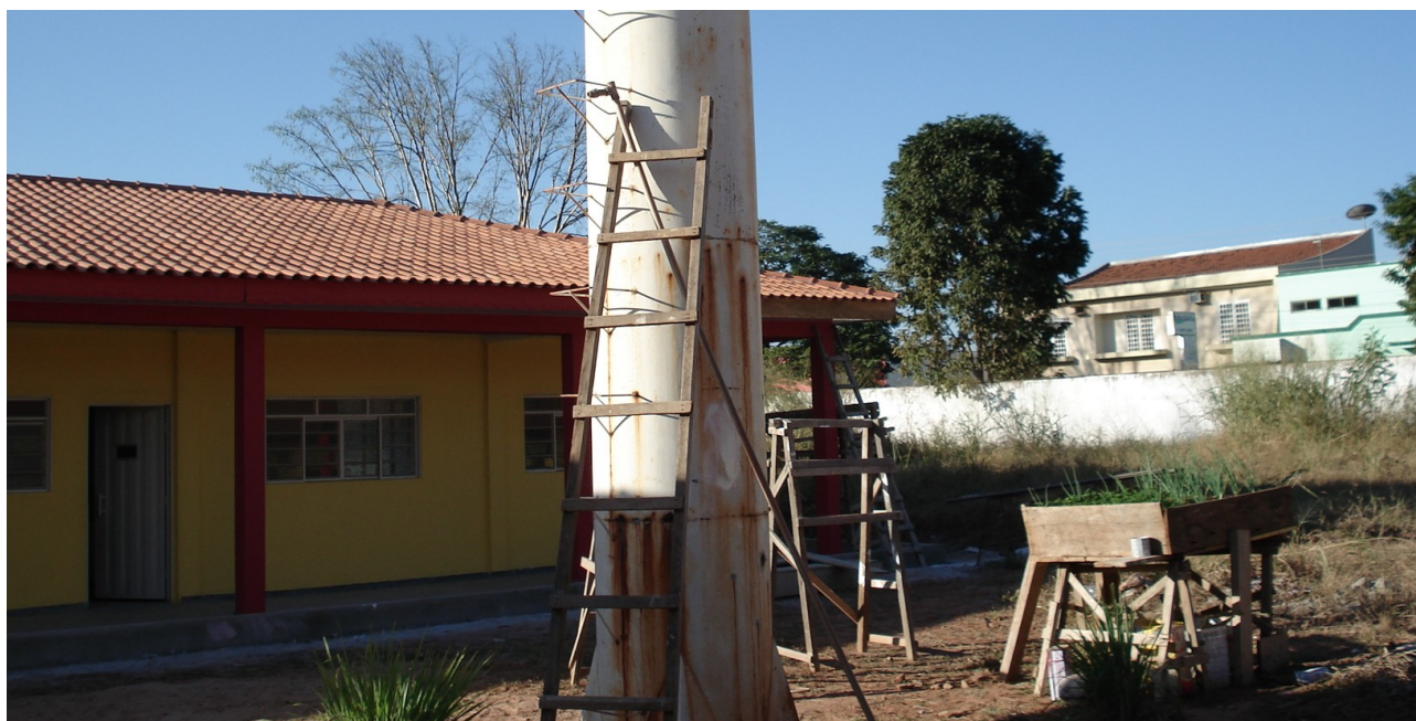
Foto 15: Caixa de água dos banheiros e cozinha inoperante devido à corrosão.