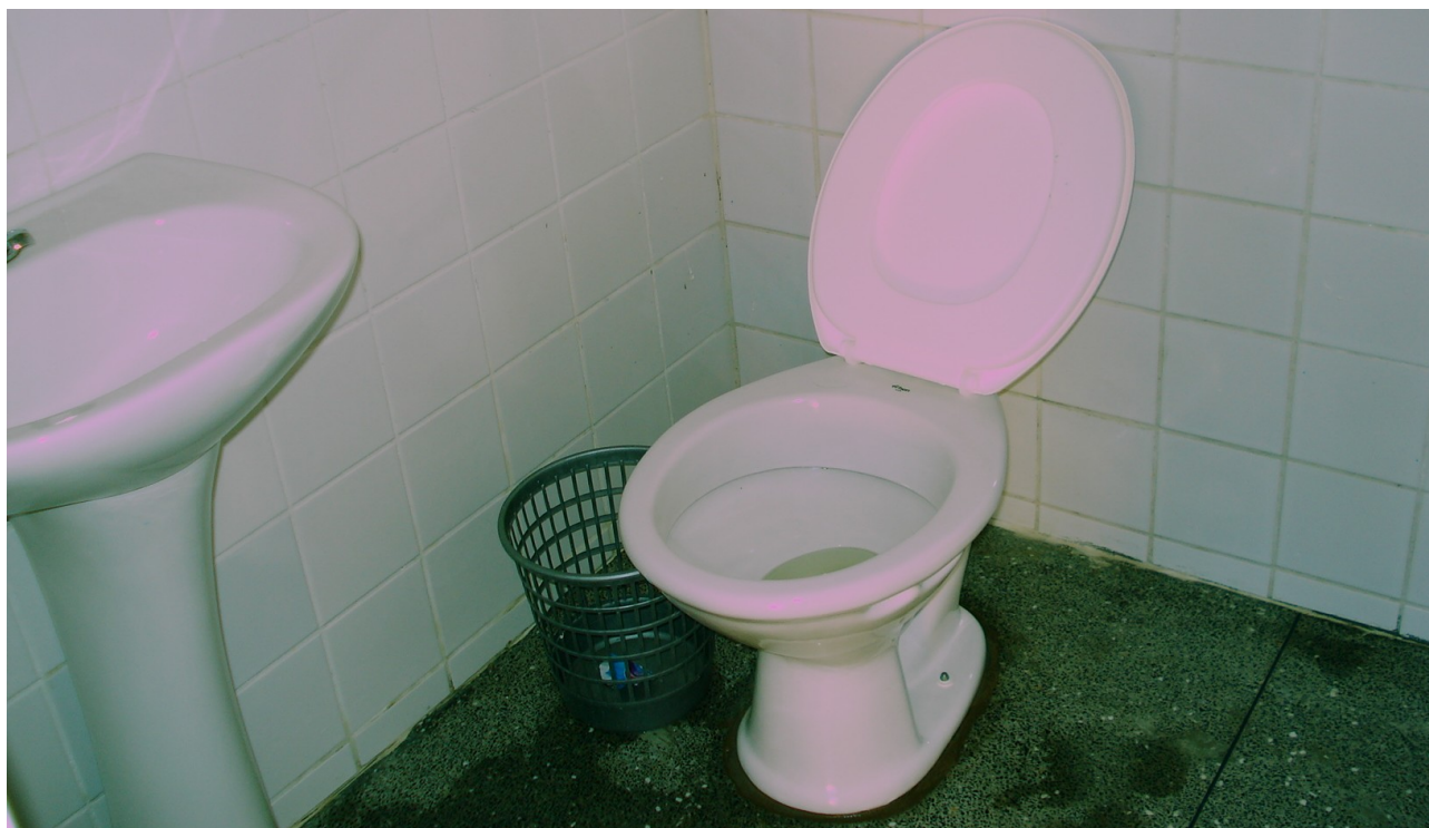
Foto 27: Sanitário PNEE fora de especificação e falta de instalação de barras de apoio.