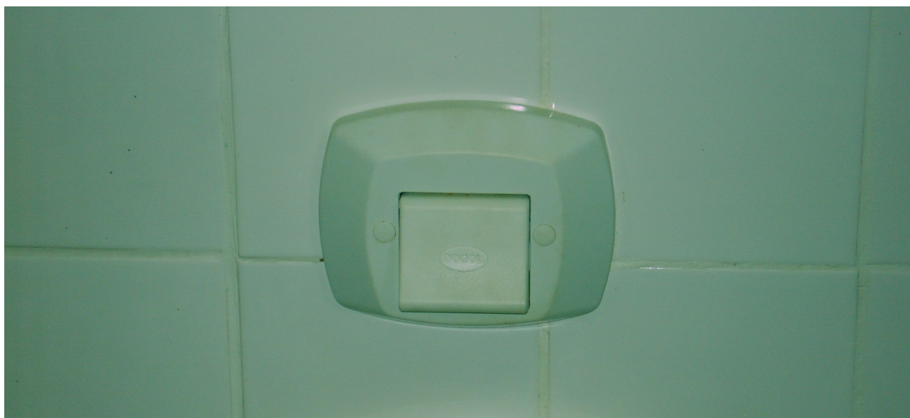
Foto 5: Válvulas de descarga em desacordo com especificação e já inoperantes.