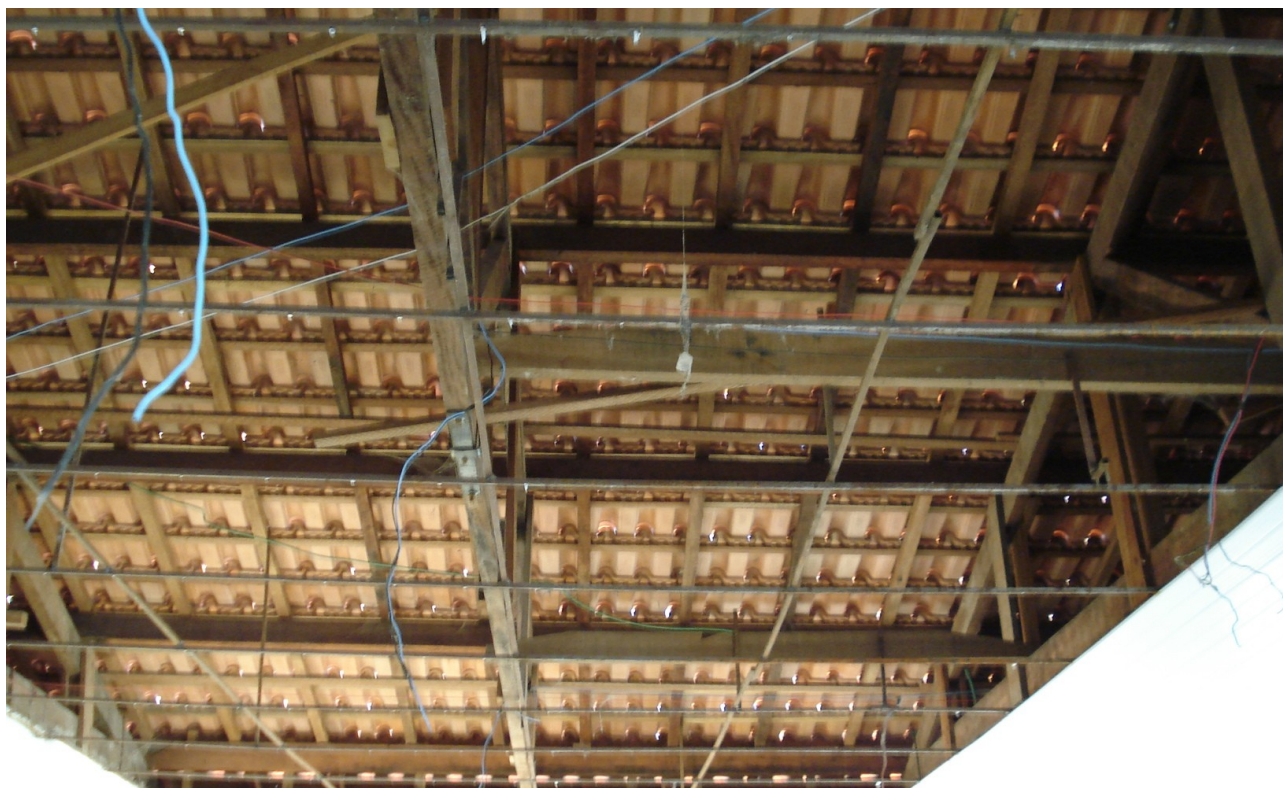
Foto 20: Forro de PVC não foi instalado no salão de uso múltiplo.