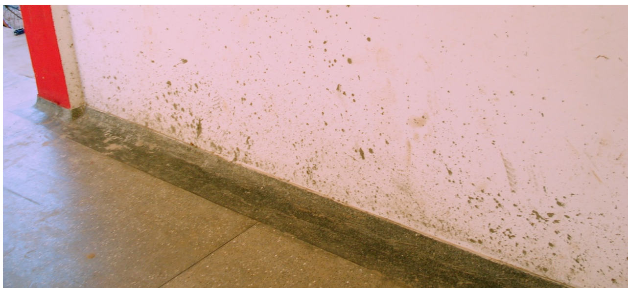
Foto 25: Danos à pintura dos corredores provocados durante execução do piso