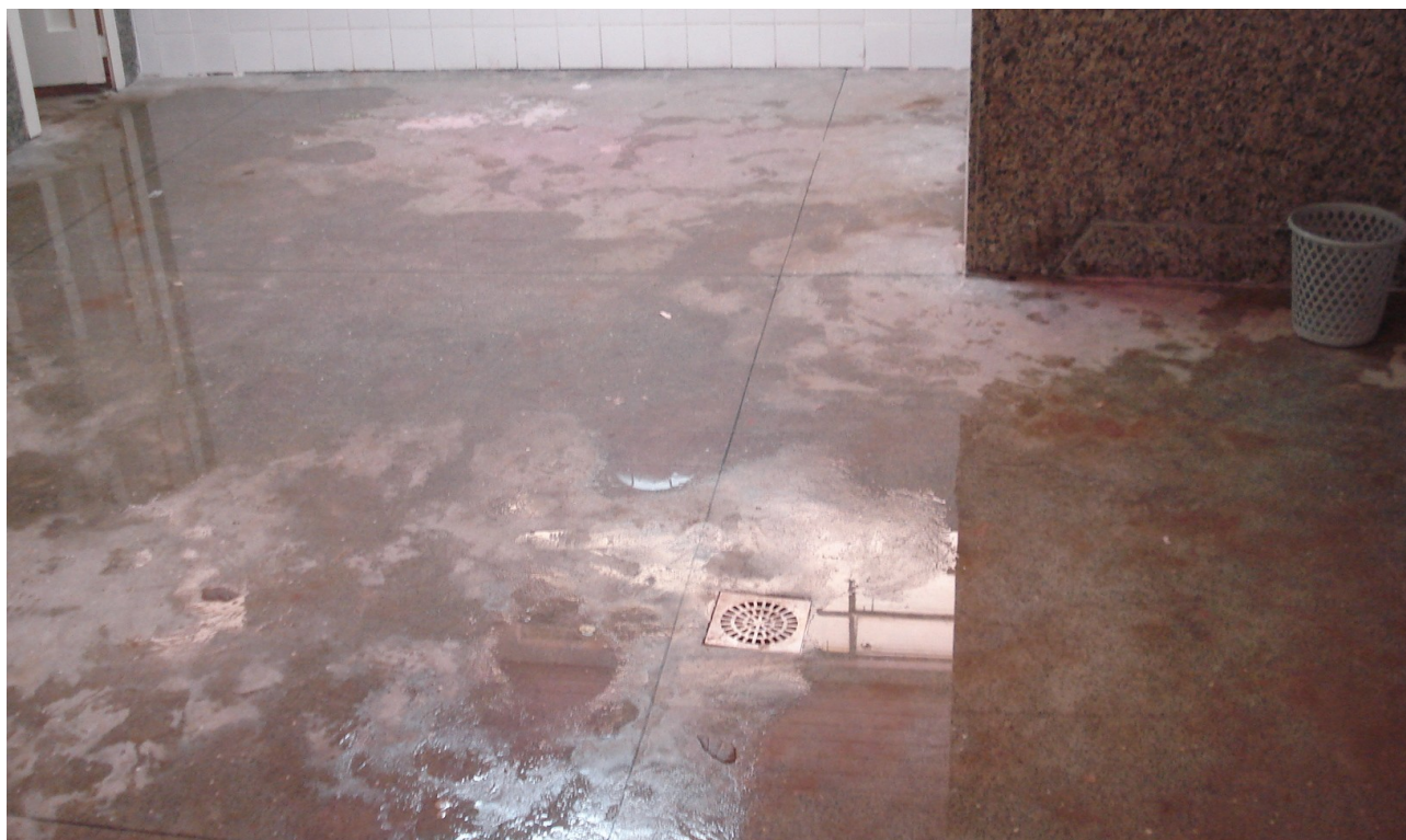
Foto 16: Caixas de água provisórias instaladas nos banheiros apresentam vazamento