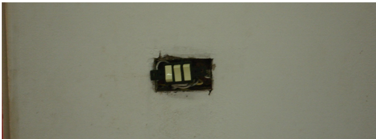
Foto 8: Em quase todos interruptores não foram instalados espelhos.