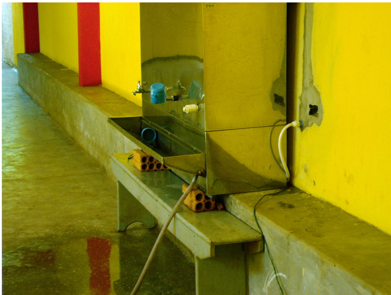
Foto 3: Instalação elétrica e fixação precários e inseguros do bebedouro de água.