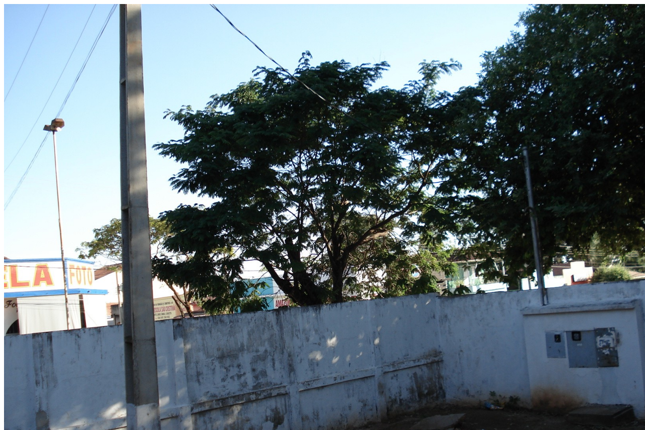
Foto 11: Padrão inadequado e fiação com emendas provocam queda de energia elétrica.

As obras estão paralisadas, estão inacabadas e há falhas graves na execução dos serviços, que serão detalhadas a seguir.