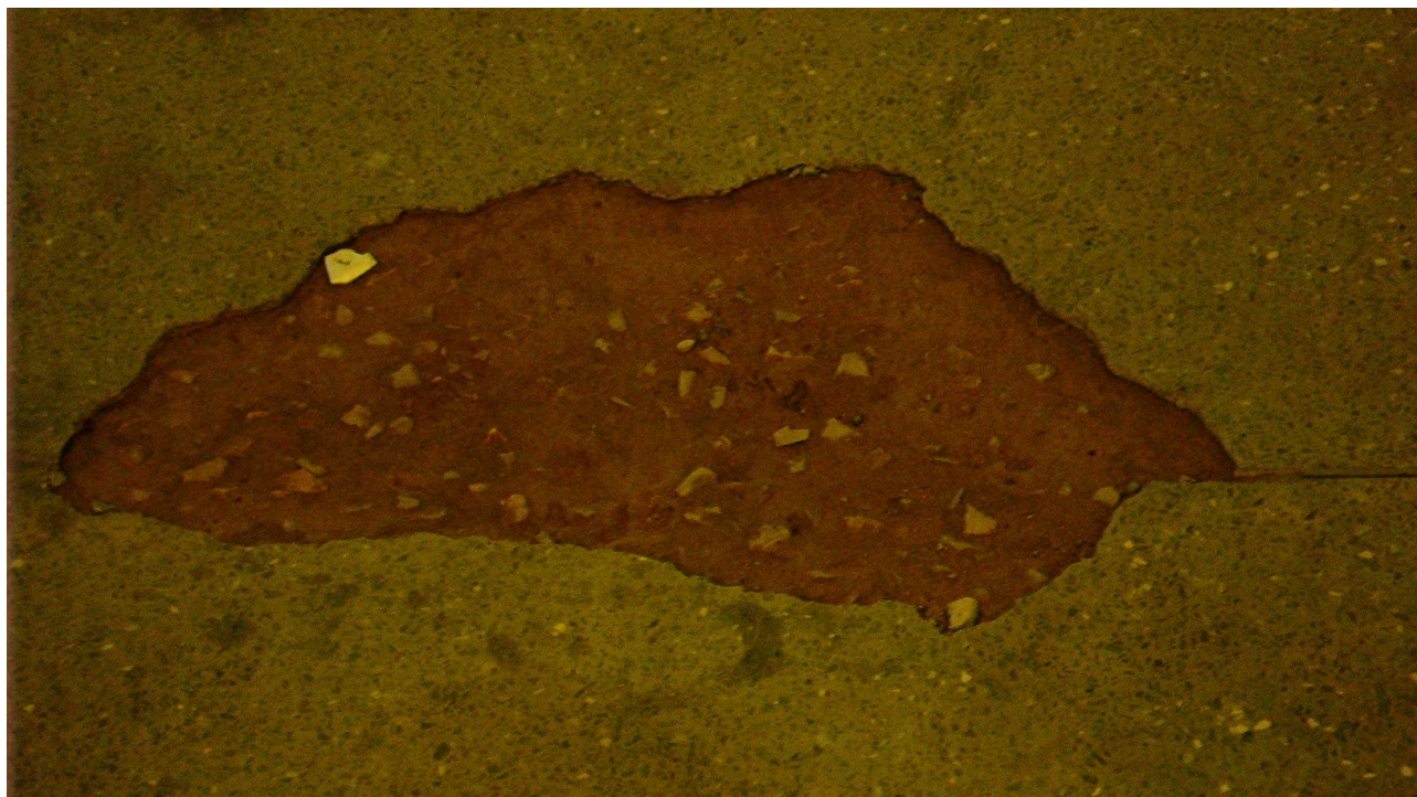
Foto 24: Deficiência na execução do piso provocando fissuras e desagregação.