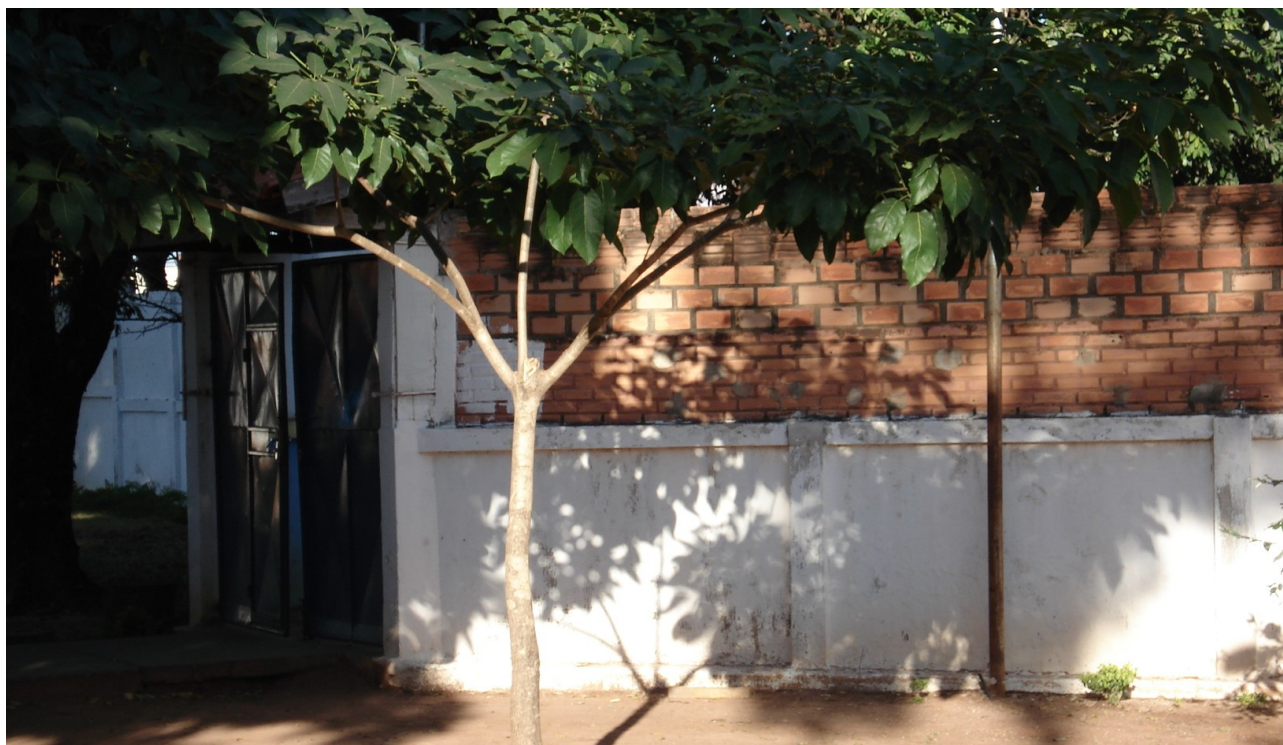
Foto 12: Entrada da escola não está concluída e rampa PNEE não foi executada.