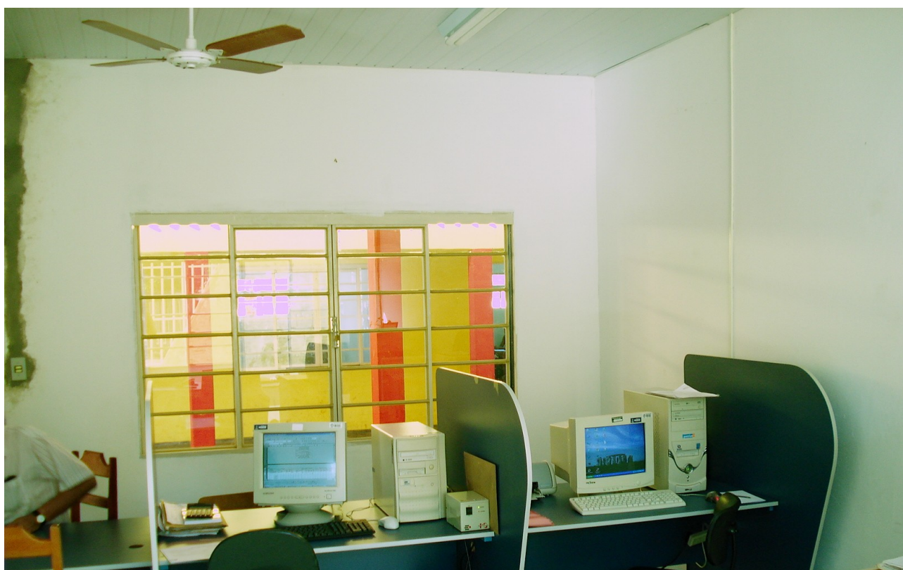
Foto 2: Não foi executada preparação para instalação de ar condicionado na secretaria.