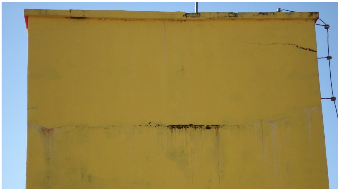
Foto 13: Reforma da caixa de água principal não concluída, vazamentos perm