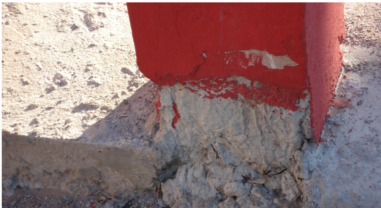
Foto 21: Há trechos de corredores inacabados que estão sem aplicação de granilite.