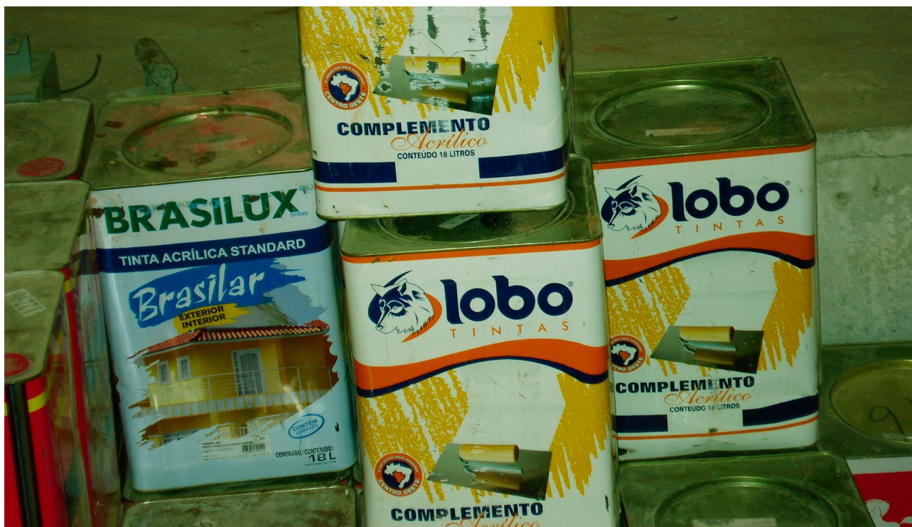
Foto 30: Utilização de material de qualidade inferior ao especificado na planilha orçamentária