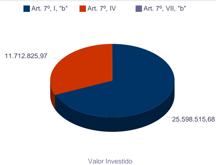
Valor Investido por Classificação (Res. CMN 3922/2010)