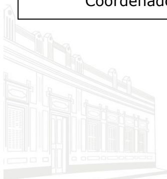
Casa Barão de Melgaço - 1ª Sede 1953

Coordenadora do Núcleo de Certificação e Controle de Sanções