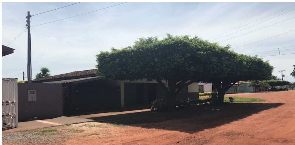
Figura 9 – Imagem endereço R. Cel Virgílio F. Almeida, 75, Centro, Rosário Oeste - MT

Figura 8 – Imagem endereço R. Cel Virgílio F. Almeida, 75, Centro, Rosário Oeste – MT