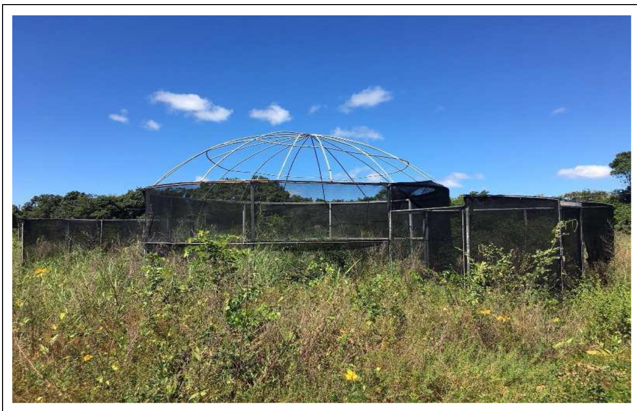
Documento Digital nº 130600/2019, fl 4.

75. Com efeito, o que se verifica do registro fotográfico anexo ao termo de inspeção realizado pelos auditores é que a estrutura entregue não teria a utilidade para a qual teria sido contratada, vejamos: