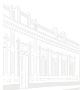
Edifício Barão de Melgaço - 1ª Sede 1953

5) Os Municípios podem instituir mediante lei guardas municipais de acordo com o § 8º do art. 144 da Constituição Federal, bem como implantar políticas de segurança pública que contemplem planos, programas, projetos e ações sociais e urbanísticas preventivas de sinistro, da violência e da criminalidade, de acordo com as diretrizes do Sistema Único de Segurança Pública – SUSP e do Programa Nacional de Segurança Pública com Cidadania – PRONASCI.