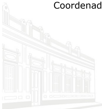
Casa Barão de Melgaço - 1ª Sede 1953

Técnico de Controle Público Externo Coordenador do Núcleo de Certificação e Controle de Sanções