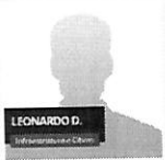
LEONARDO D. Informática