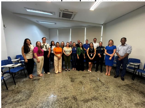
Reunião com gestores e servidores da Prefeitura de Lucas do Rio Verde para aplicação de entrevista