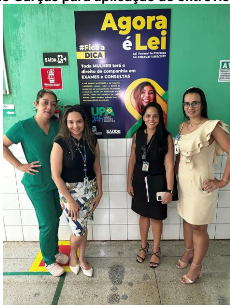
Reunião com gestora e enfermeira da UPA de Barra do Garças para aplicação de entrevista