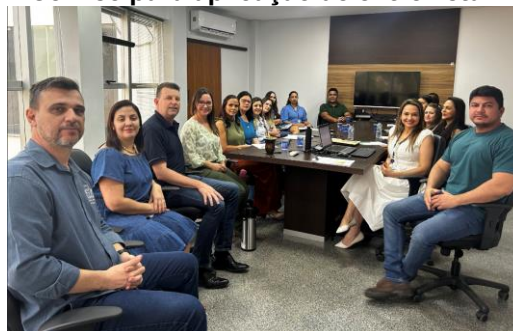
Reunião na Prefeitura Municipal de Sorriso para aplicação de entrevista