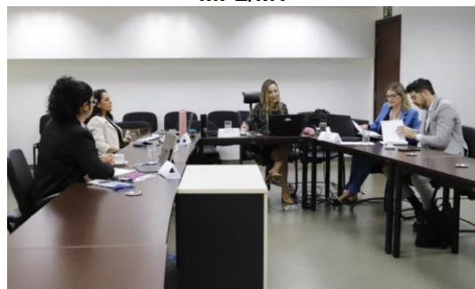
Reunião de planejamento (MATRIZ SWOT) com o Coordenador do Centro de Apoio Operacional e Violência Doméstica do MPE/MT