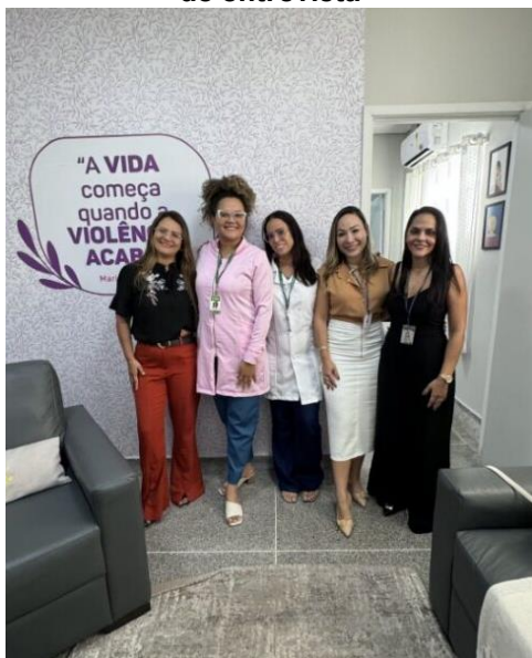
Visita à Defensoria em Cuiabá para aplicação de entrevista