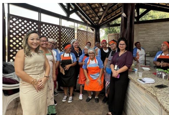
Visita à Casa de Sarita Várzea Grande para aplicação de entrevista