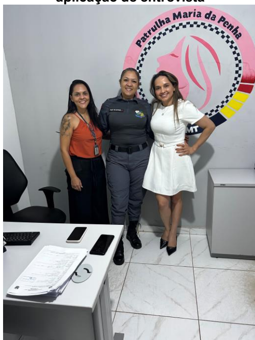
Visita à Patrulha Maria da Penha de Cáceres para aplicação de entrevista