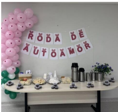
Visita no HMC em Cuiabá para aplicação de entrevista