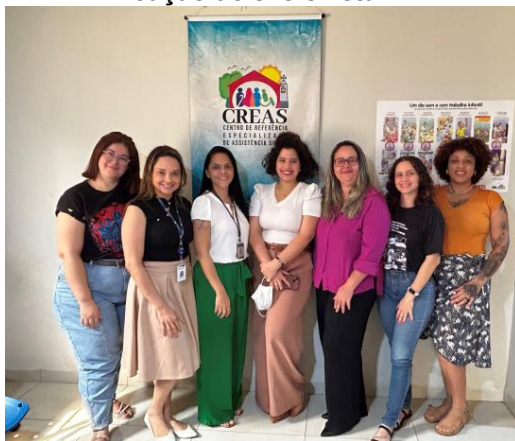
Visita ao CREAS de Cáceres para aplicação de entrevista