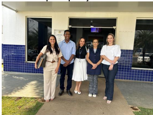
Visita à Unidade de Pronto Atendimento de Lucas do Rio Verde para aplicação de entrevista