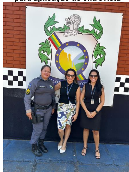
Reunião com a responsável pela Patrulha Maria da Penha de Barra do Garças para aplicação de entrevista