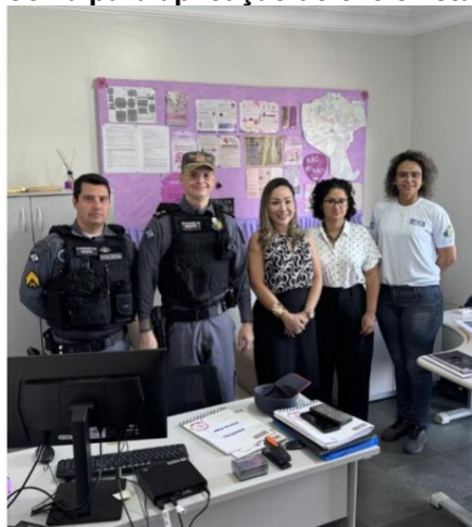
Visita à Patrulha Maria da Penha em Tangará da Serra para aplicação de entrevista