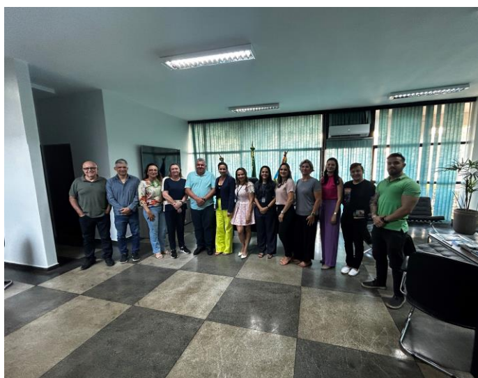
Reunião com as Secretárias e setores da Prefeitura de Barra do Garças para aplicação de entrevista