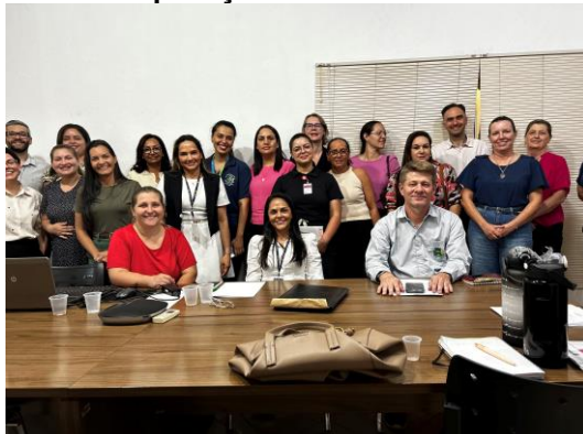
Reunião na Prefeitura Municipal de Sinop para aplicação de entrevista