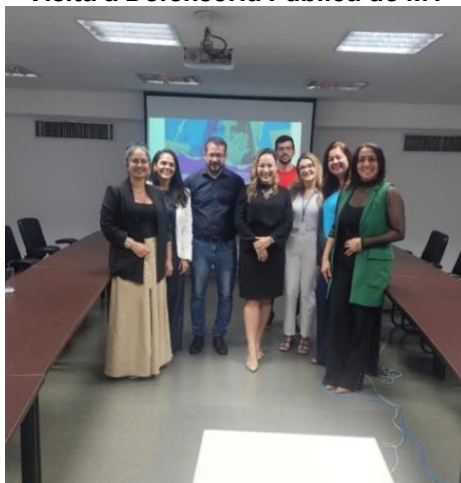
Visita à Defensoria Pública de MT