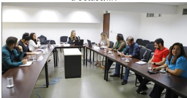
Reunião de planejamento (MATRIZ SWOT) com a Setasc/MT