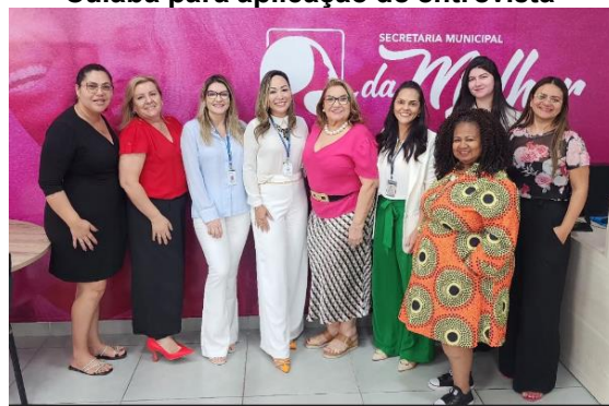
Visita à Secretaria Municipal de Mulher em Cuiabá para aplicação de entrevista