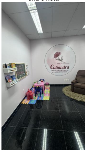
Visita ao Espaço Caliandra para aplicação de entrevista