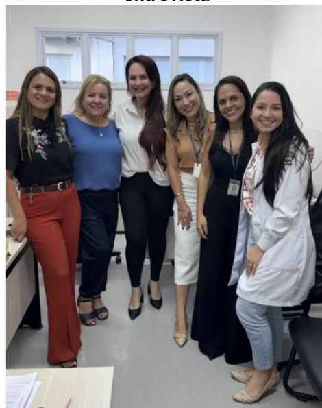
Visita na Assembleia Legislativa para aplicação de entrevista