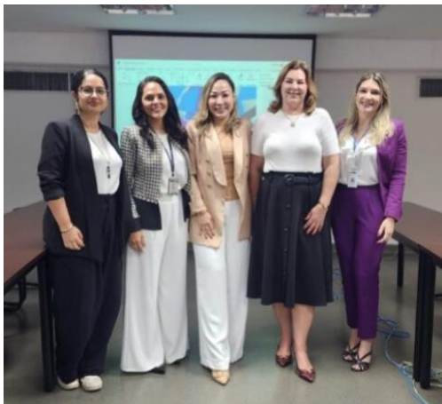
Reunião de planejamento (MATRIZ SWOT) com o MPE/MT - 16ª Promotoria Criminal de Cuiabá