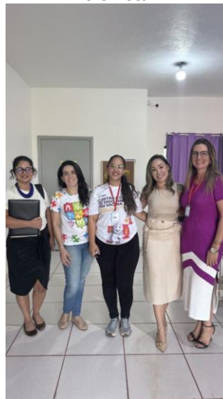
Visita à unidade de atenção básica em Chapada dos Guimarães para aplicação de entrevista