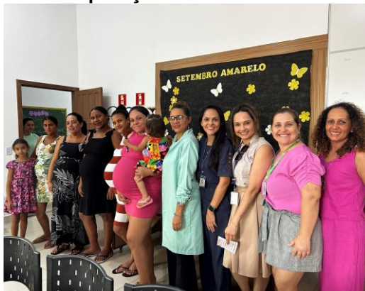
Visita à Casa da Mulher de Sorriso para aplicação de entrevista