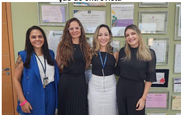
Visita à Casa de Amparo em Cuiabá para aplicação de entrevista