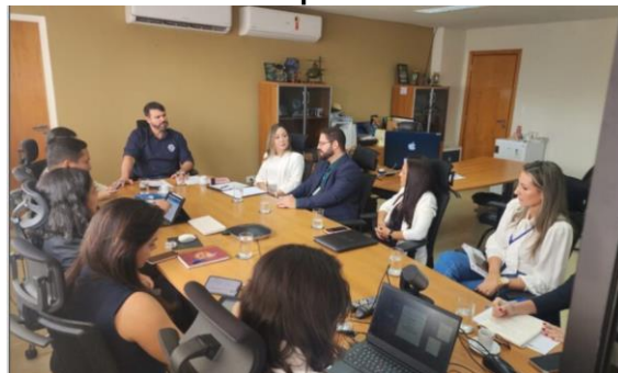
Reunião de apresentação da equipe na Sesp/MT