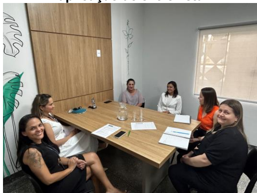
Visita no CRAS de Sorriso para aplicação de entrevista