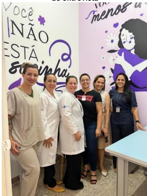
Visita à unidade de saúde de Sorriso para aplicação de entrevista