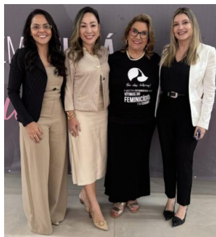
Visita à UPA em Cuiabá para aplicação de entrevista