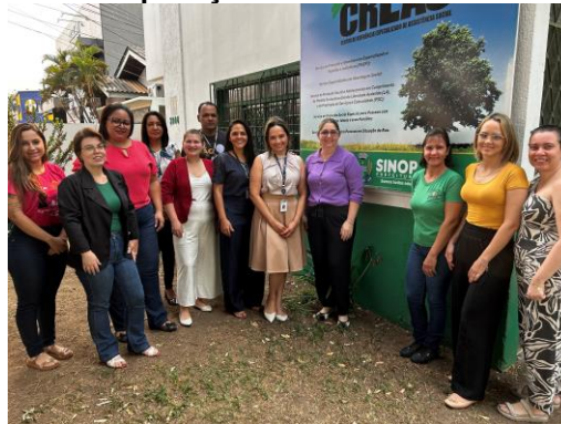
Visita no CREAS de Sinop para aplicação de entrevista