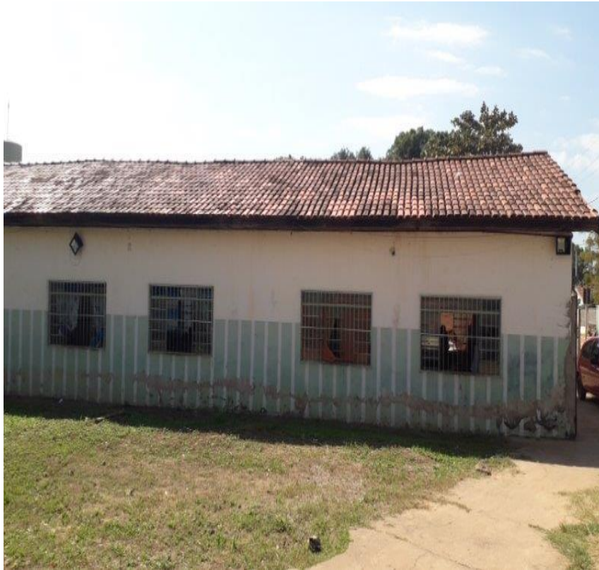
Foto 07- Beiral em reforma