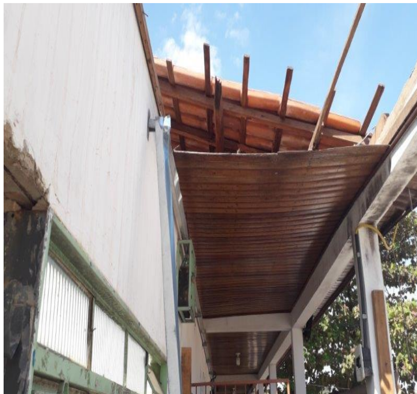
Foto 08 - Forro/telhado do corredor em reforma