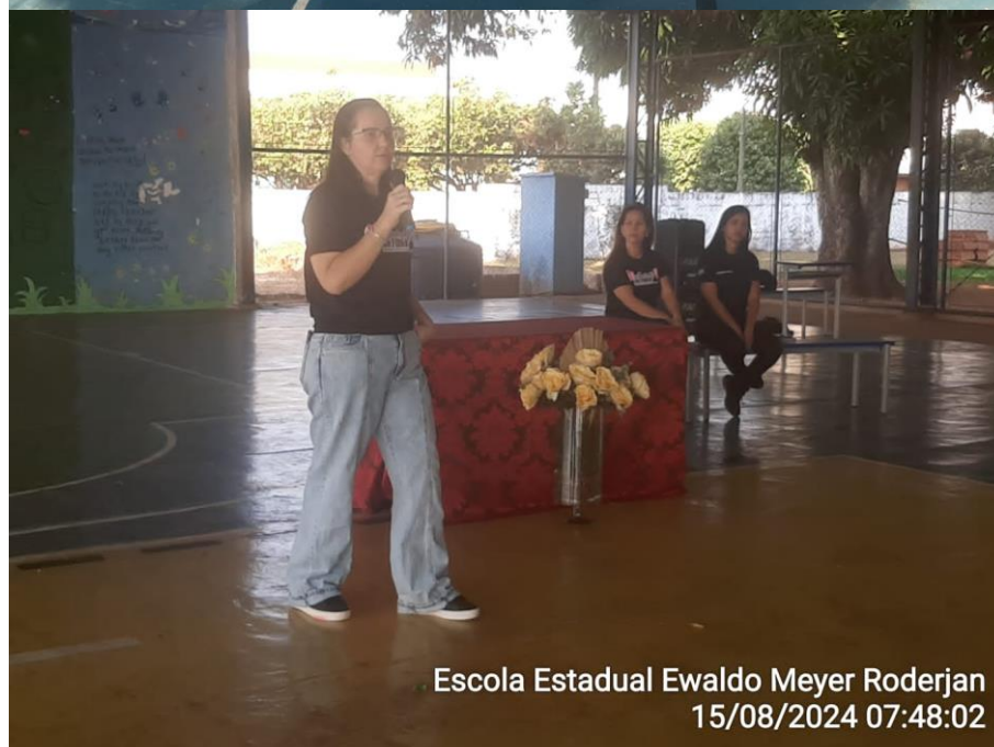
Escola Estadual Ewaldo Meyer Roderjan 15/08/2024 07:48:02