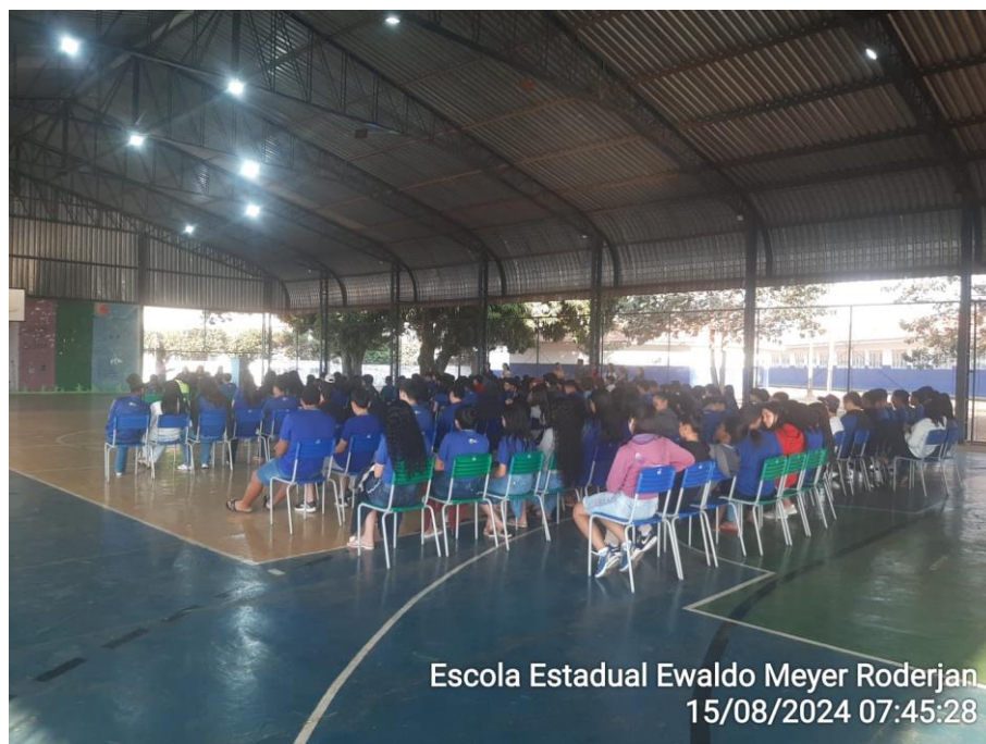
Escola Estadual Ewaldo Meyer Roderjan 15/08/2024 07:45:28